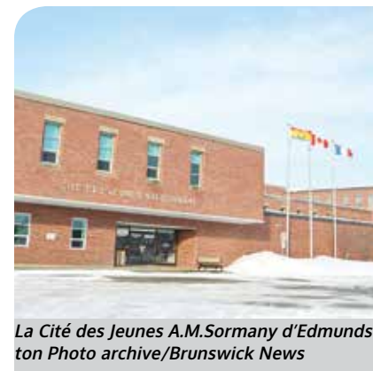
La Cité des Jeunes A.M. Sormany d'Edmundston

« Par contre, à la différence des autres