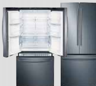
Réfrigérateur 22" Black stainless