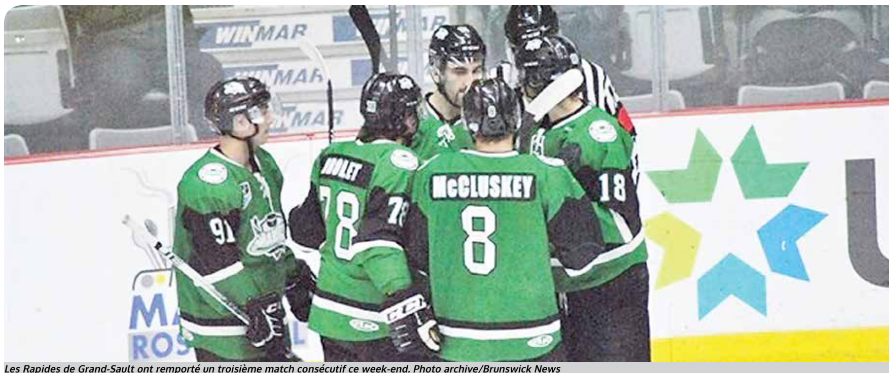
Les Rapides de Grand-Sault ont remporté un troisième match consécutif ce week-end.