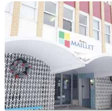
Les administrateurs du Centre Maillet souhaitent prendre possession du bâtiment. Pour l'instant, il appartient au ministère des Transports et de l'Infrastructure du Nouveau-Brunswick.

« On voit que le besoin est là et on veut aider nos artistes à continuer. On a le Centre des arts qui est là pour développer