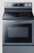
Cuisinière convection Black stainless