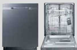
Lave-vaisselle encastré Black stainless