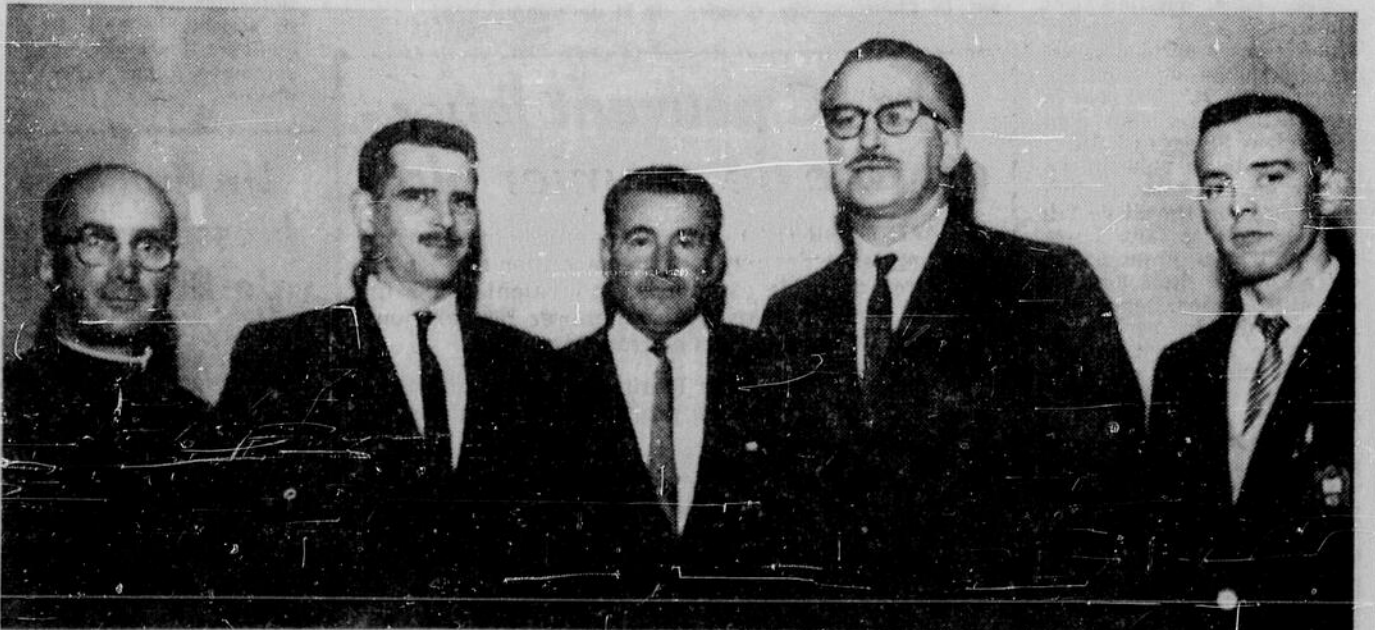
REUNION DES API A SUDBURY — Les principaux officiers de la Fédération des Associations de parents et instituteurs étaient de passage à Sudbury, en fin de semaine. A cette occasion, une réunion conjointe des API de la région a eu lieu à la bibliothèque municipale de Sudbury. La photo nous

C'est facile, c'est profitable de placer une annonce classée dans les pages de l'"Edition du Nord".