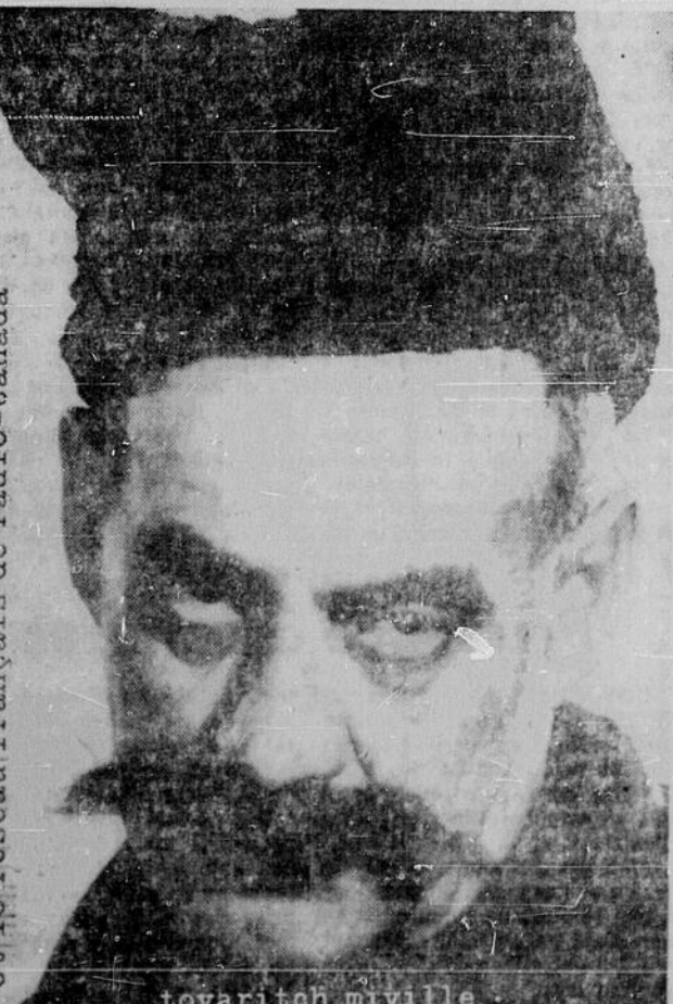
et le réseau français de radio-canada tovariton niville CFBR 55 tous les matins à 8 heures SUDBURY L'ANTENNE FRANÇAISE DU NORD A SUDBURY

C'est facile, c'est profitable de placer une annonce classée dans les pages de l'"Edition du Nord".