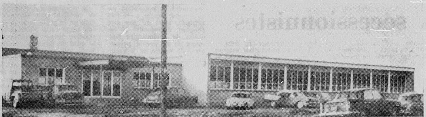
NOUVELLE ECOLE SEPARÉE ANGLAISE — L'école séparée de langue anglaise Notre-Dame-de-l'Espérance, de Val-Caron, a été bénie dimanche dernier par le Père Omer Dubuc, curé, en présence d'un grand nombre de parents et d'in-

voités, des membres de la Commission scolaire de l'endroit. Cette école reçoit les élèves de langue anglaise mais, au besoin, elle pourra devenir école bilingue.