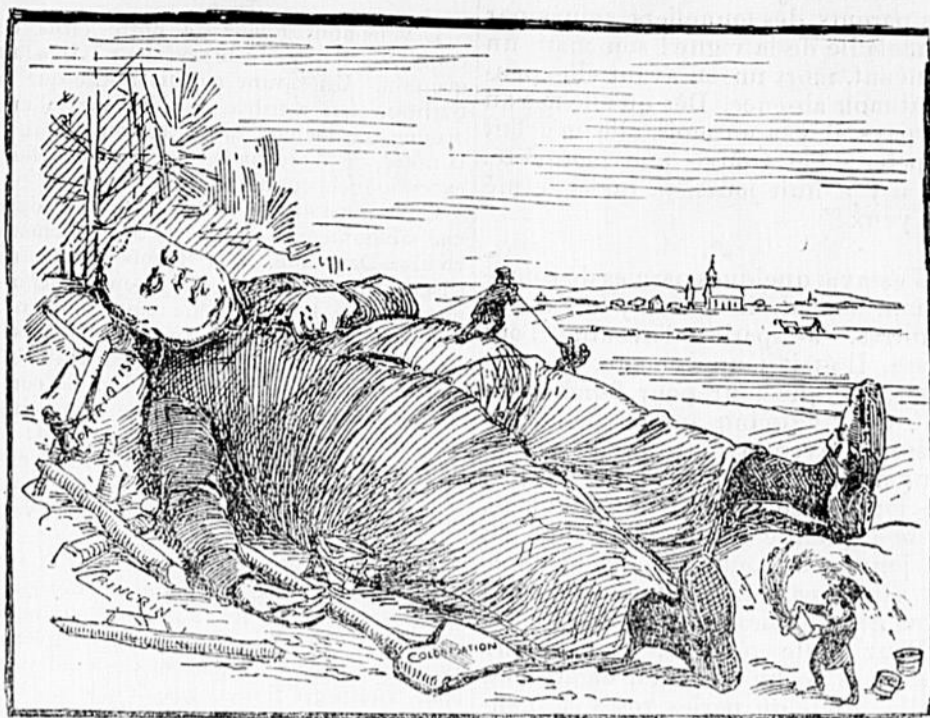
LE CURÉ LABELLE ET MERCIER

Et, après une inclination de la plus bienséante correction, Cartouche s'allongea nonchalamment et s'endormit sans peur ni