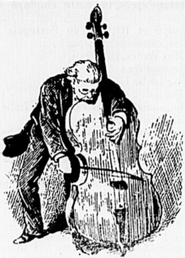
LES PAQUES DE CARTOUCHE

On était en 1721. Le régent et Cartouche régnaient à Paris ; l'un du haut du trône de son oncle Louis XIV, ce dont il s'accommodait fort ; l'autre, du haut des toits de la capitale dont il possédait une carte minutieusement dressée. Le régent avait inventé les petits-soupers du Palais-Royal et les bals masqués de l'Opéra. Cartouche, un raffiné de mœurs, de sang-froid, de courage, avait, de son côté tout comme monseigneur Philippe d'Orléans, sa cour, son alcôve et, voire, son chirurgien. On ne parlait alors, à Paris, que des bons mots et des hauts faits de l'aimable bandit, qui recommandait la douceur à ses coupe jarrets et à ses vide-goussets, mettait le guet toujours sur les dents, souvent en défaut et le rossait à l'occasion.