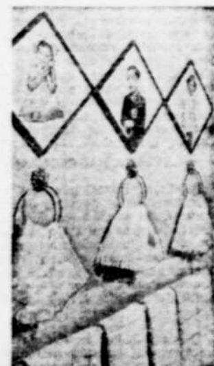
Vos petits reconnaîtront très bien leur serviette respective, si vous placez la photo de chacun d'eux au-dessus de cette serviette.

ces papiers sur le mur en essayant diverses combinaisons. Vous éviterez ainsi de planter des clous inutilement dans vos murs, et vous obtiendrez un effet à votre goût.