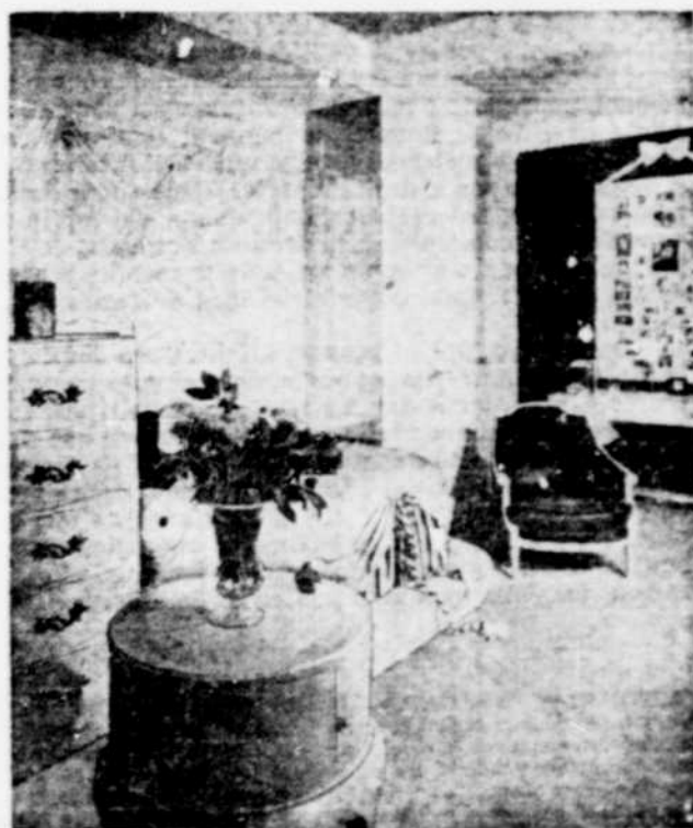
Un grand tableau sur lequel vous collez plusieurs portraits peut se placer facilement dans une chambre à coucher.

Les yeux bleus disent: Aime-moi ou j'en mourrai. Les yeux noirs disent: Aime-moi ou tu mourras. — Proverbe espagnol.