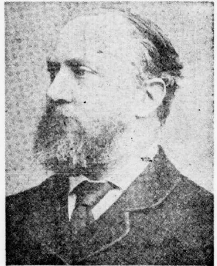
Frederick Arthur Preston, lord Stanley, donateur de la fameuse coupe qui porte son nom, fut gouverneur du Canada de 1888 à 1893. Il mourut en 1908 en Angleterre, sans avoir jamais vu une joute de hockey!

Aucune compétition n'eut lieu en 1898. La première joute véritablement rude de l'histoire prit place en 1899, à Montréal, alors que les Vics de Montréal affrontèrent les Vics de Winnipeg. Montréal remporta le trophée pour la troisième année consécutive mais la première joute fut marquée de sang, de batailles et de larmes. La série ne fut pas terminée. Les joueurs de Winnipeg regagnèrent leur demeure sans la coupe et en colère. Vingt