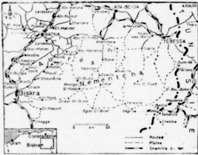
Des violents combats en Algérie — Les rebelles déploient une grande activité dans les Aurès-Nementcha. Ces derniers jours, de violents combats se sont produits près de Batna. Comme le montre notre carte, les Aurès-Nementcha forment la région montagneuse entre le chemin de fer qui passe par Batna et Biskra et la frontière tunisienne.