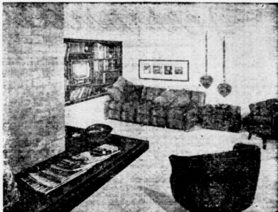
Il y a place pour les portraits de famille dans votre boudoir. Ici, on en a réuni quatre dans le même cadre qui garnissent très bien le mur au-dessus du sofa.

Mélangez 1\frac{1}{2} carré de chocolat dans 1\frac{1}{2} cuillère à soupe d'eau chaude. Mélangez bien. Peut servir 12 personnes.