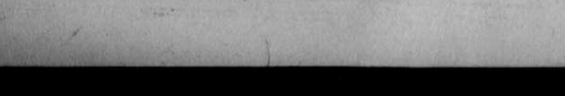
The Ponyman, c/o. Everywoman's World, Dept. 110 Toronto, Ont.