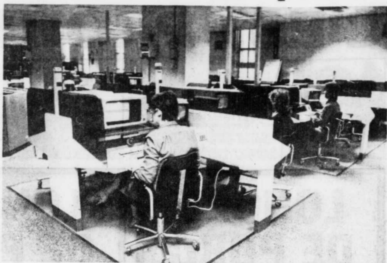
Le Soleil, René St-Pierre