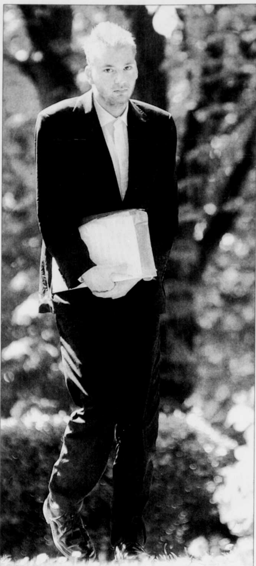
Nul ne sait d'où vient ce jeune homme mince, qui a visiblement entre 20 et 30 ans, et dont le regard triste s'affichait lundi dans plusieurs quotidiens britanniques. La plupart du temps, « L'homme au piano », comme il a été surnommé, joue des œuvres de sa composition. Il est inséparable d'une pochette contenant des partitions.