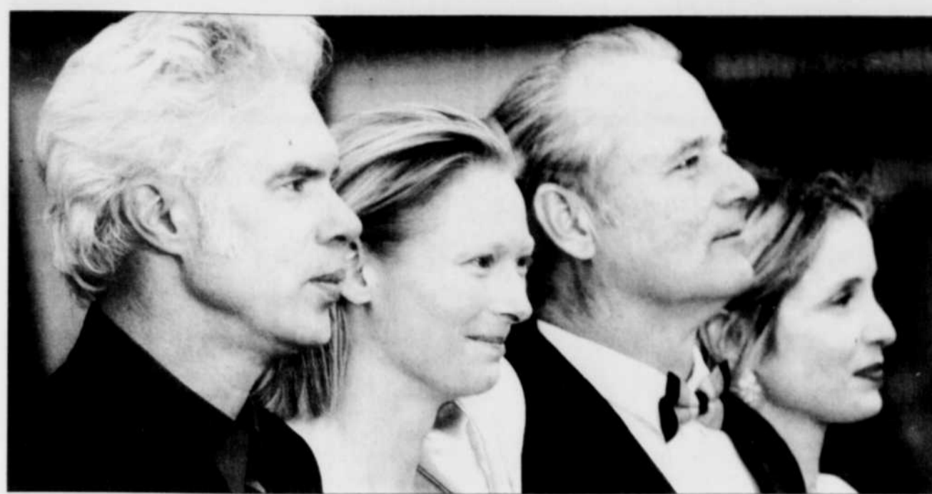
L'équipe de « Broken Flowers », Jim Jarmusch, Tilda Swinton, Bill Murray et Julie Delpy, sur le tapis rouge, hier.