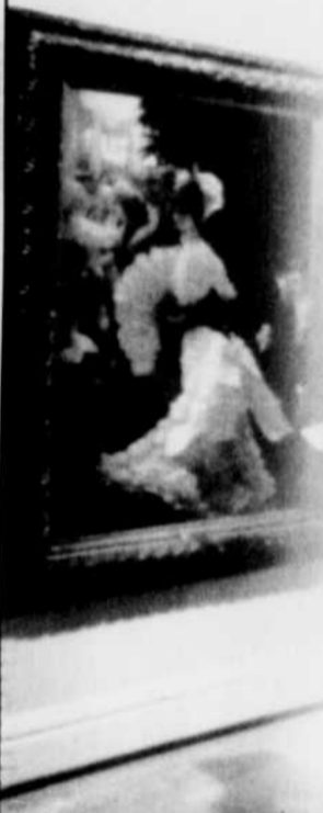
Musée national des beaux-arts de Québec, photographe : Jean-Guy Kérouac.