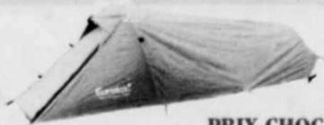
MOON SHADOW DUO 3 saisons. 2 places. Armature d'aluminium. 4,9' x 8,6' x 3,3'. Poids : 5,4 lb. N° 151644. Cour. : 249,95