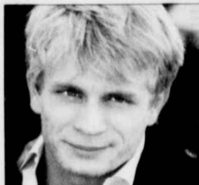
L'acteur Jérémie Renier joue dans le film « L'Enfant » des frères Luc et Jean-Pierre Dardenne.

□ VU : un solide film des frères Luc et Jean-Pierre Dardenne en compétition, L'Enfant , qui marche dans les pas du Fils ou de Rosetta . Palme d'or il y a six ans. Fébrile comme un reportage en direct, sans fard et sans reproche, le film suit au corps un jeune Belge marginal, dont l'éthique pourrait être la suivante : la vie se vit au jour le jour, et tant pis pour le reste. « Un boulot, dit-il, c'est pour les enfoirés. » Alors Bruno fait les 400 coups, petit criminel prêt à tout pour n'importe quoi pour quelques billets. Même le bébé que vient d'avoir sa copine, qu'il vend à son insu. « On n'a qu'à en faire un autre ! » On imagine la réaction catastrophée de la fille, et les conséquences