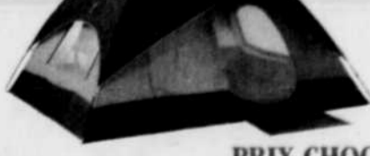
TETRAGON 1210 Familiale 3 saisons. 5 à 6 places. Armature en fibre de verre. 10' x 12' x 6'. N° 146390. Cour. : 349,95