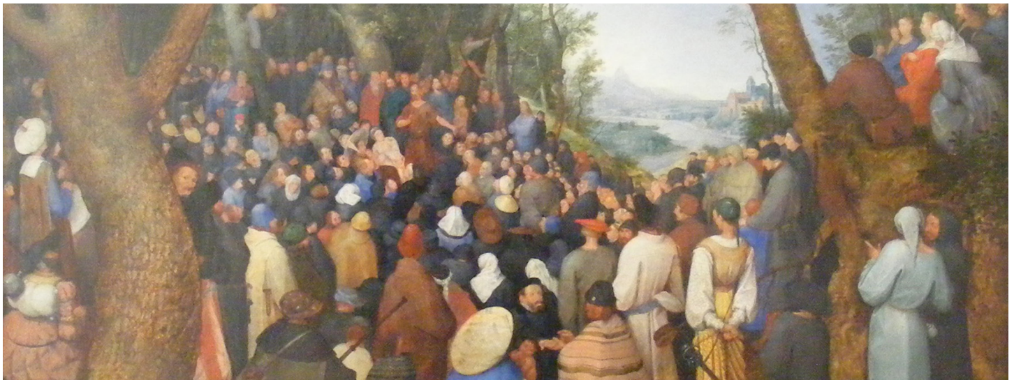
Jan Brueghel l'Ancien, peintre baroque flamand (1568-1625), titre de la toile Le Sermon sur la montagne réalisée en 1597.

«Venez à moi, vous tous qui êtes fatigués et chargés, Et je vous donnerai du repos. Prenez mon joug sur vous et recevez mes instructions, car je suis doux et humble de cœur ; et vous trouverez du repos pour vos âmes. Car mon joug est doux, et mon fardeau léger. » Jésus (Matthieu 11.28-30) □