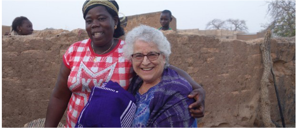
Louta et Soula

Avec toutes les veuves aidées par le Projet Dorcas , louez le Seigneur avec moi :