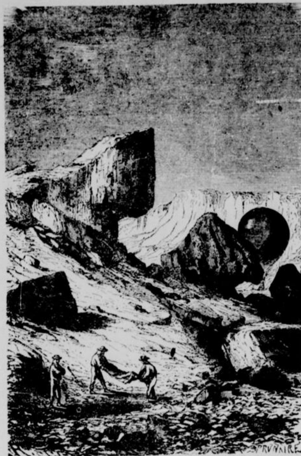
L'ensevelissement du missionnaire

L'ordre du docteur fut exécuté. Une brise à peine saisissable poussait doucement le Victoria au-dessus du prisonnier, en même temps qu'il s'abaissait insensiblement avec la contraction du gaz. Pendant dix minutes environ, il resta flottant au milieu des ondes lumineuses. Fergusson plongeait sur la foule son faisceau étincelant, qui dessinait çà et là de rapides et vives plaques de lumière. La tribu, sous l'empire d'une indescriptible crainte, disparut peu à peu dans ses huttes, et la solitude se fit autour du poteau. Le docteur avait donc eu raison de compter sur l'apparition fantastique du Victoria , qui projetait des rayons de soleil dans cette intense obscurité.