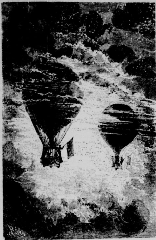
Le ballon inattendu