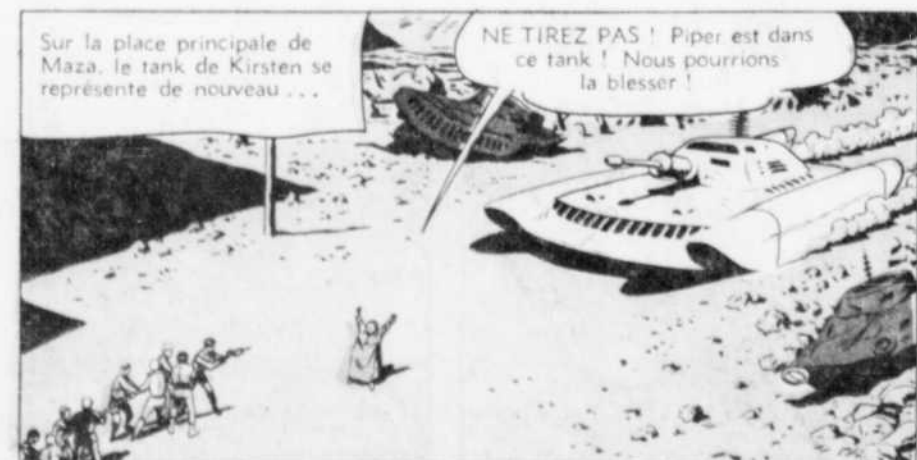
Sur la place principale de Maza, le tank de Kirsten se représente de nouveau...