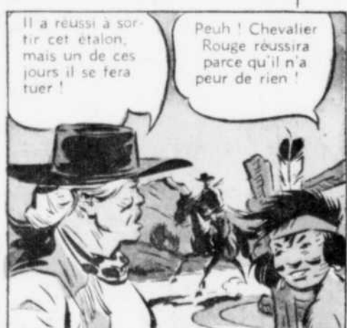
Il a réussi à sortir cet étalon, mais un de ces jours il se fera tuer!