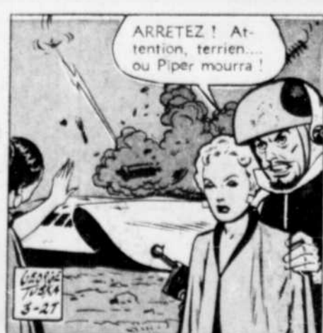
ARRETEZ! Attention, terrien... ou Piper mourra!

Recevez gratuitement le localisateur d'étoiles. Postez une enveloppe affranchie avec ce coupon à Buck Rogers, a/s de ce journal.