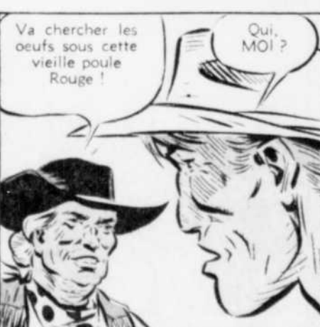
Va chercher les oeufs sous cette vieille poule Rouge!