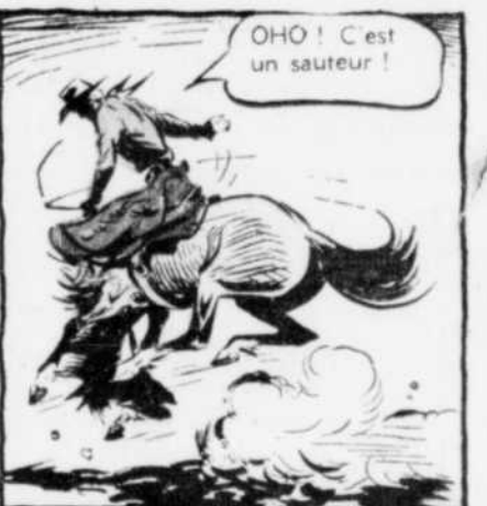
OHO! C'est un sauteur!