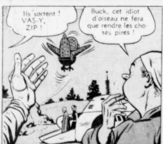
Ils sortent! VAS-Y, ZIP!