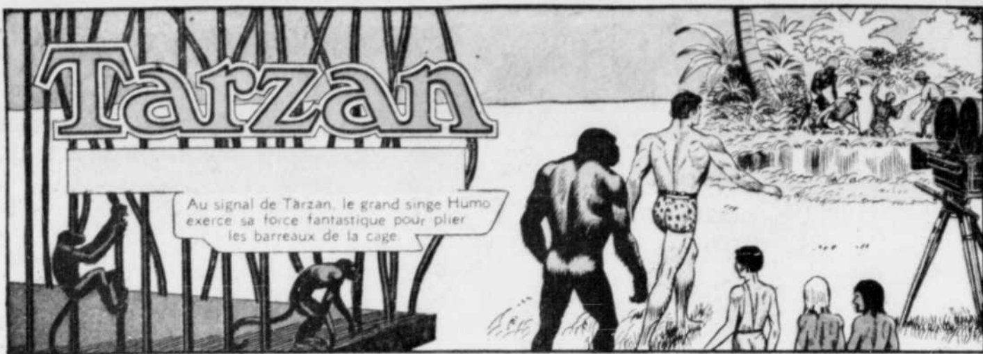
Au signal de Tarzan, le grand singe Humo exerce sa force fantastique pour plier les barreaux de la cage.