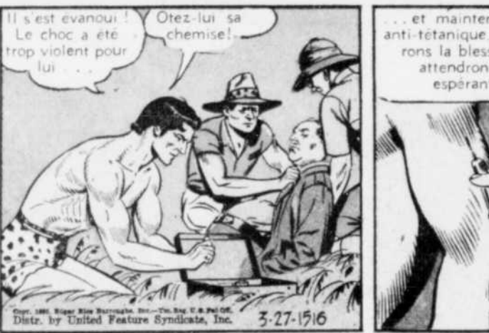
Il s'est évanoui! Le choc a été trop violent pour lui.