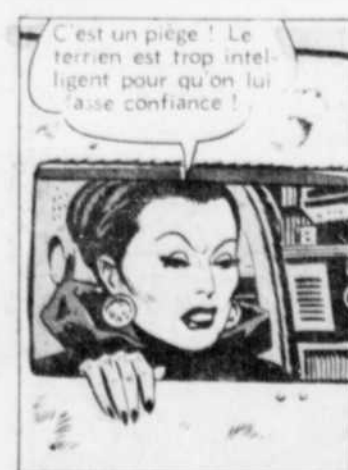
C'est un piège! Le terrien est trop intelligent pour qu'on lui fasse confiance!