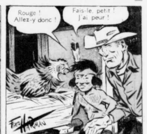
Rouge! Allez-y donc!