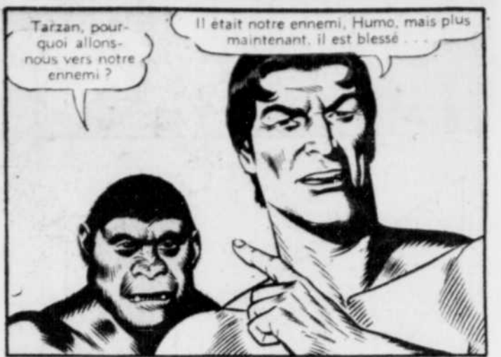
Tarzan, pourquoi allons-nous vers notre ennemi ?