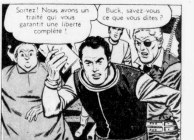
Sortez! Nous avons un traité qui vous garantit une liberté complète!