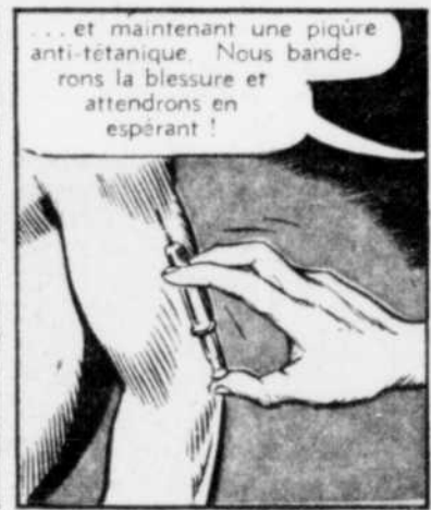
... et maintenant une piqûre anti-tétanique. Nous banderons la blessure et attendrons en espérant!