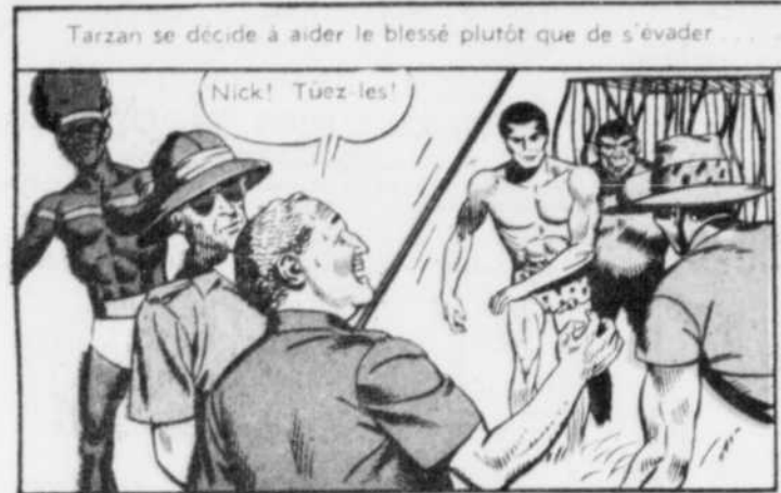
Tarzan se décide à aider le blessé plutôt que de s'évader.