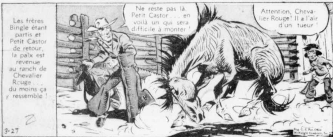
Les frères Bingle étant partis et Petit Castor de retour, la paix est revenue au ranch de Chevalier Rouge... du moins ça ressemble!