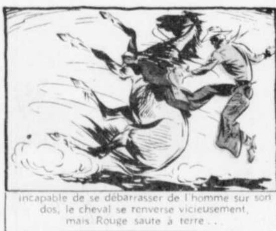
incapable de se débarrasser de l'homme sur son dos, le cheval se renverse vicieusement, mais Rouge saute à terre...