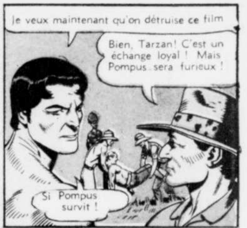
Je veux maintenant qu'on détruise ce film.