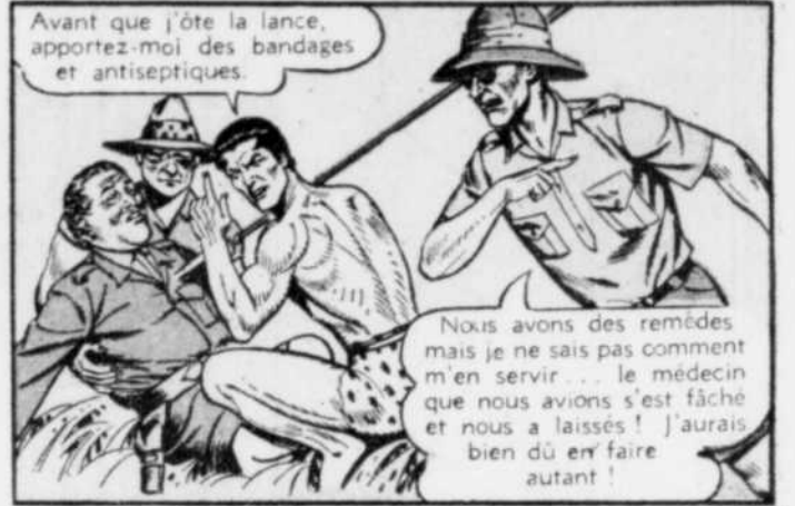
Avant que j'ôte la lance, apportez-moi des bandages et antiseptiques.