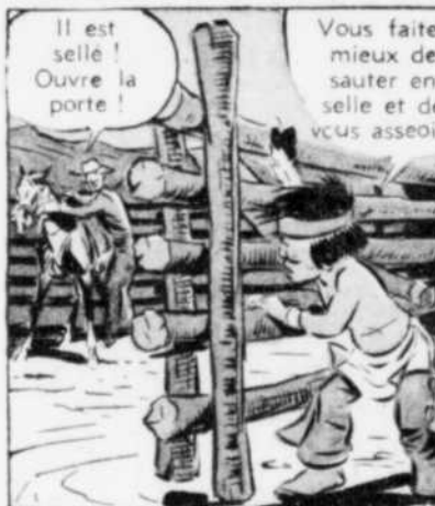
Il est sellé! Ouvre la porte!