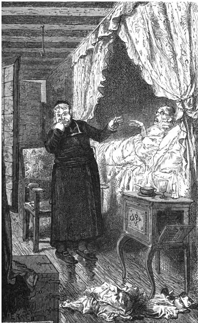
La fin du chevalier de Vaucelas.