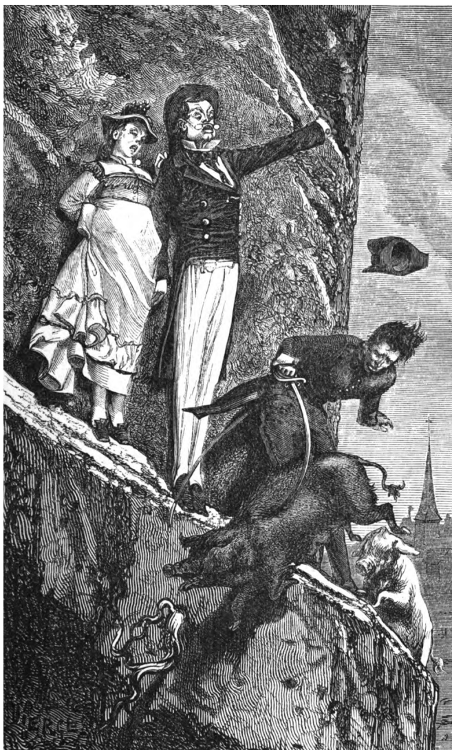
Le cruel trépas de Cypris.