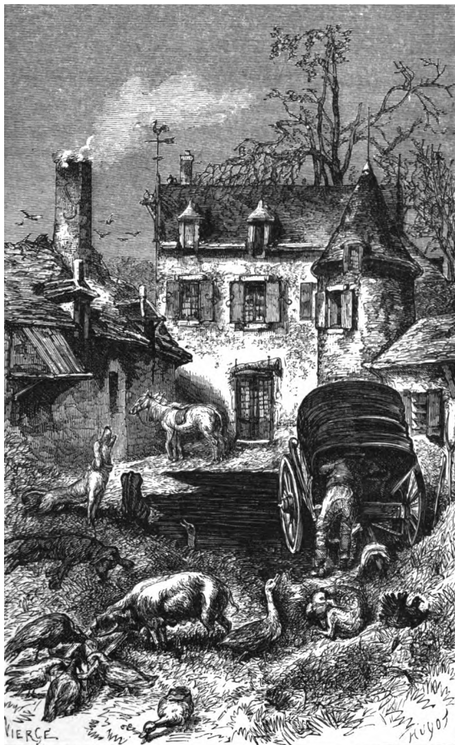
Le château du chevalier de Vaucelas