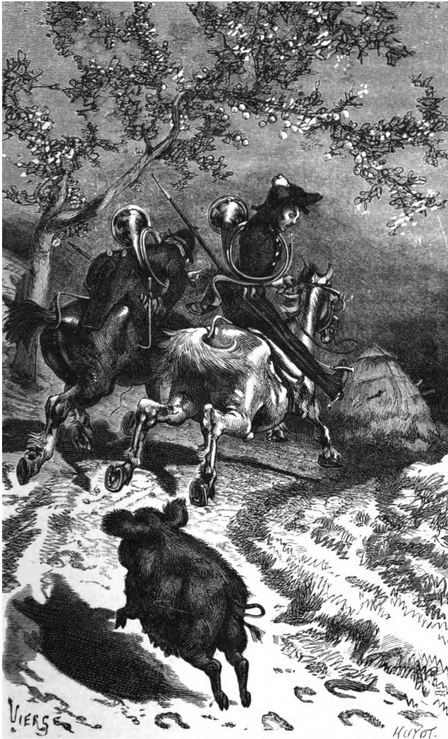
La chasse à courre.