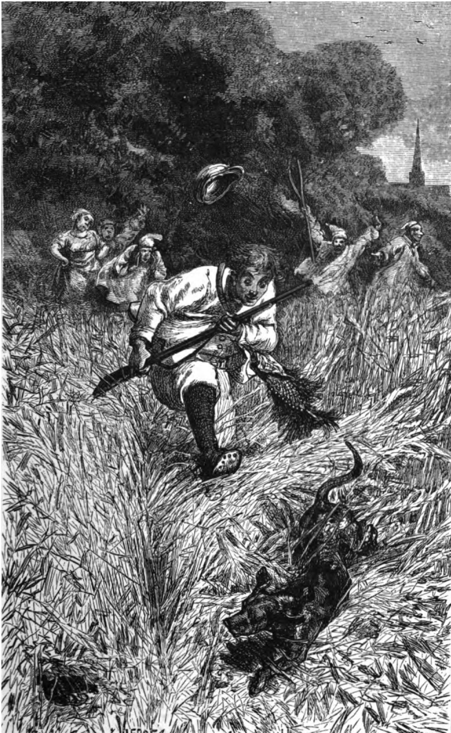
Le neveu du chevalier de Vaucelas dans les blés noirs.