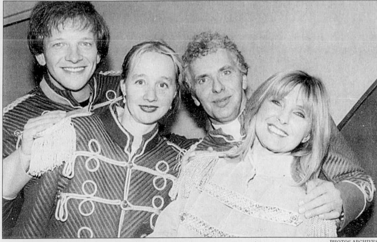
Les vedettes du Bye Bye 1995: André-Philippe Gagnon, Diane Lavallée, Serge Thériault et Dominique Michel. «Là où se concentre surtout le débat sur la qualité, c'est autour de la portion minime des comédies et des émissions d'humour, qui représente 2,5 % de notre programmation.»

La promotion de la culture «d'élite», comme certains la définissent, semble soulever beaucoup d'inquiétude dans les milieux intellectuels. Dans un contexte qui n'est pas facile, nous continuons pourtant de produire et de diffuser des œuvres de création dans le domaine de la musique, de la danse et de la dramaturgie. Notre programmation des Beaux Di-