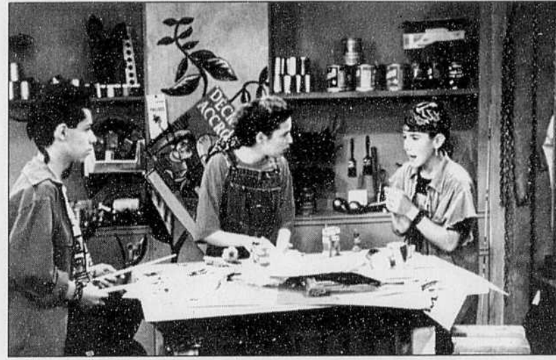
Une scène de l'émission Watatatow (1993-94). «La programmation jeunesse occupe 20 % de la grille-horaire.»

Là où se concentre surtout le débat sur la qualité, c'est autour de la portion minime des comédies et des émissions d'humour, qui représente 2,5 % de notre programmation. On