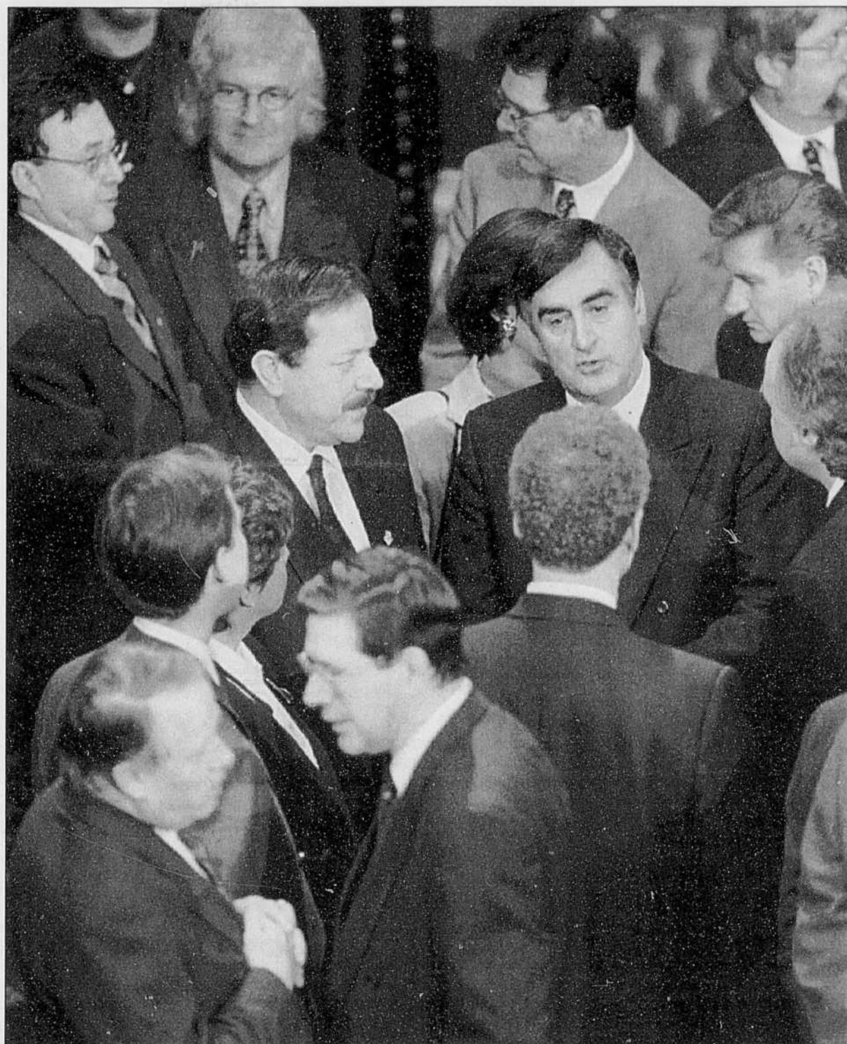
C'est un conseil des ministres méconnaissable, auquel n'accèdent pas moins de dix nouveaux visages et qui perd six de ses membres qu'a présenté Lucien Bouchard hier au Salon rouge.