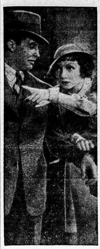
CLAUDETTE COLBERT et RAY MILLAND dans une scène du film "POWER".