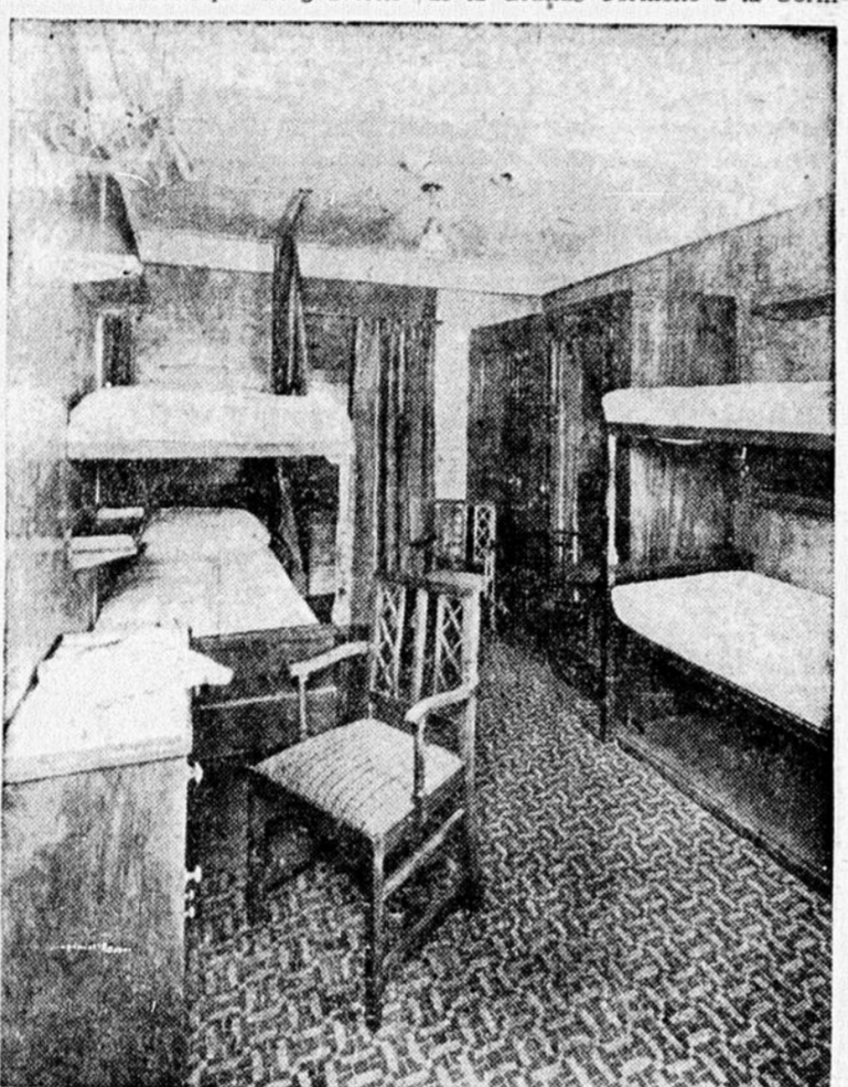
Une cabine à 4 lits, classe touristique, à bord de l'Empress of Britain. C'est sur ce magnifique vaisseau que reviendront au Canada les voyageurs de notre Tour de 37 jours qui voudront prolonger leur séjour à Paris.

Durant leur séjour à Nice, nos voyageurs auront l'occasion de faire une promenade sur la Grande Corniche, route merveilleuse, accrochée aux flancs des Alpes et d'où l'on a un spectacle unique sur la mer et les jolies petites villes en bas de la falaise. Cette route passe pour être l'une des plus belles au monde au point de vue scénique. Le gouverne-