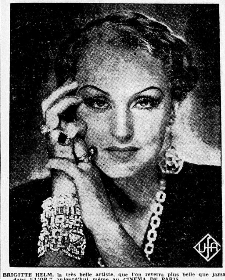
BRIGITTE HELM, la très belle artiste, que l'on reverra plus belle que jamais dans "L'OR" aujourd'hui même au CINEMA DE PARIS.