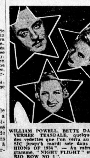
WILLIAM POWELL, BETTE DAVIS et VERREE TRISDALE, quelques-unes des vedettes que l'on verra au CLASSIC jusqu'à mardi soir dans "FASHION OF 1934". — A l'affiche demain, "NIGHT FLIGHT" et "RADIO ROW NO 1".