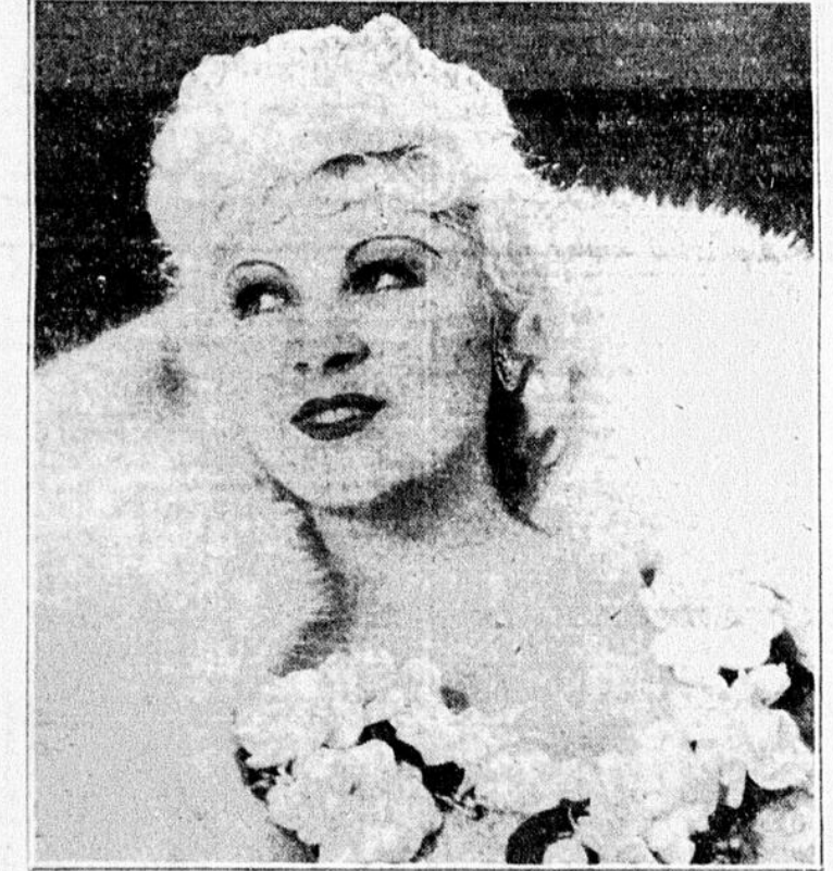
MAE WEST se tourne du côté moderne dans "GOIN' TO TOWN", qui passera au CAPITOL trois jours commencent demain, avec une comédie d'EDGAR KENNEDY, une caricature Mickey Mouse "MICKEY'S MAN FRIDAY", un sportlight et les Actualités Fox. — Au CAPITOL, aujourd'hui : "GEORGE WHITE'S SCANDALS" et "THE GREAT HOTEL MURDER".