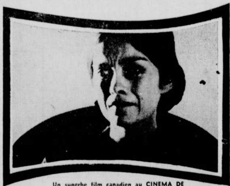
Un superbe film canadien au CINEMA DE PARIS. "Kamouraska" de Claude Jutra avec Geneviève Bujold. ■