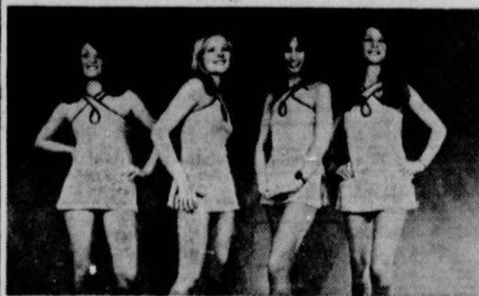
Parmi ces quatre charmantes demoiselles, une seule aura l'honneur d'être élue MISS BONANZA 73 qui figurera dans une grande promotion estivale à CFCM-TV et CKMI-TV.