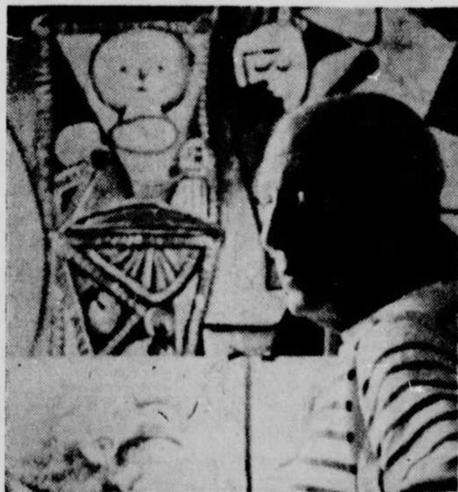
Au cinéma de 14h.30, mercredi le 2 mai, nous pourrons rendre hommage à l'artiste Pablo Picasso. CBVT.