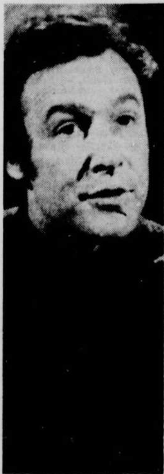
"Après 7½" à la Télévision Communautaire de Québec TCQ.

TCQ—"La paix: Un peu beaucoup, passionnément"