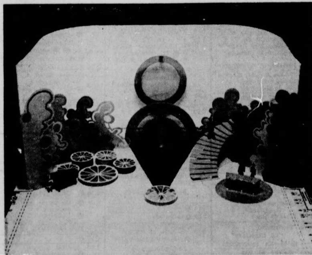
Voici la maquette du gala des Prix Oranges et Citron à Appelez-moi Lise le 11 mai à 23 h.00 CBVT.