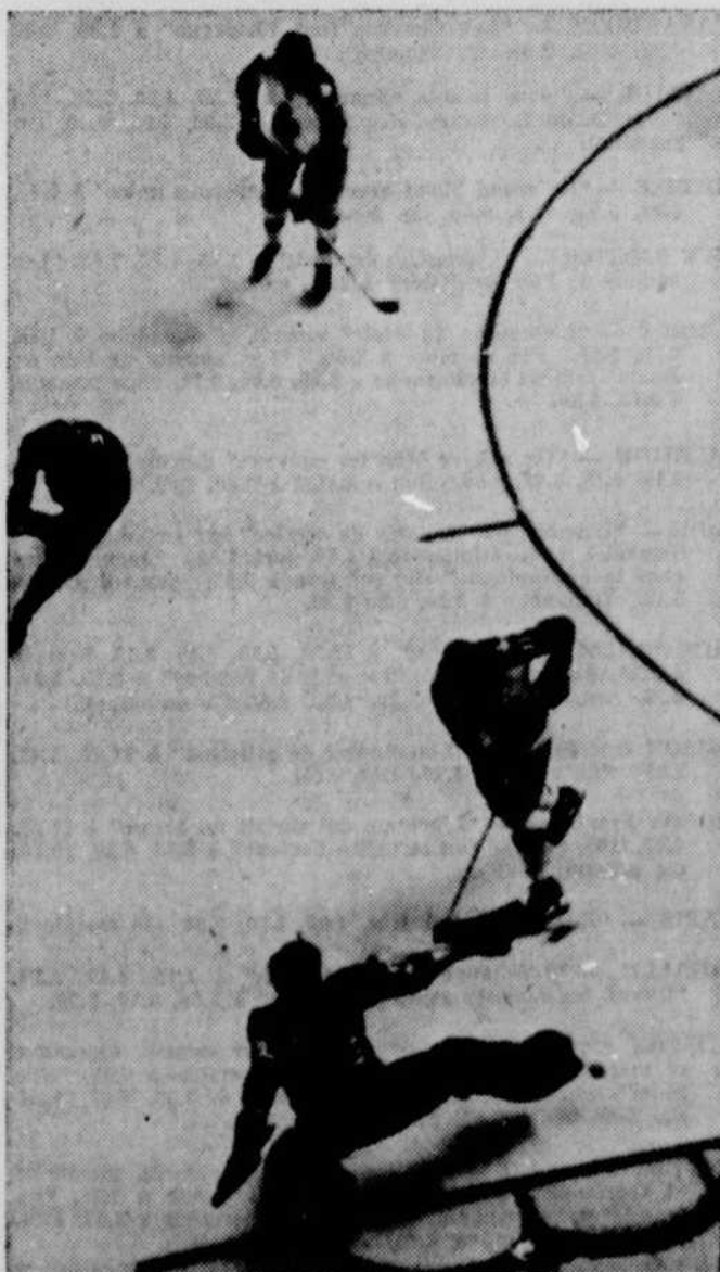
Ne manquez pas les finales de la série Canadiens-Chicago à la Soirée du Hockey, CBVT.