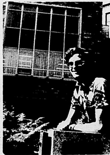
Richard Doyle Biologie

Catalogue de recherches bien documenté, bibliographie. Pour sous-gradués, gradués et autres. Documents envoyés une seule fois par école. Bas tarifs. Livraison: une semaine à 10 jours. TEL: [514] 331-2114.