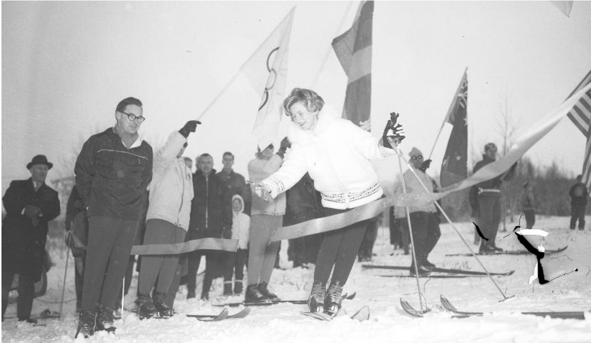
Lors de l'inauguration, le 17 décembre 1960, c'est la Canadienne Ann Heggveit, médaillée d'or aux Jeux olympiques de Squaw Valley en 1960, qui coupait le traditionnel ruban.