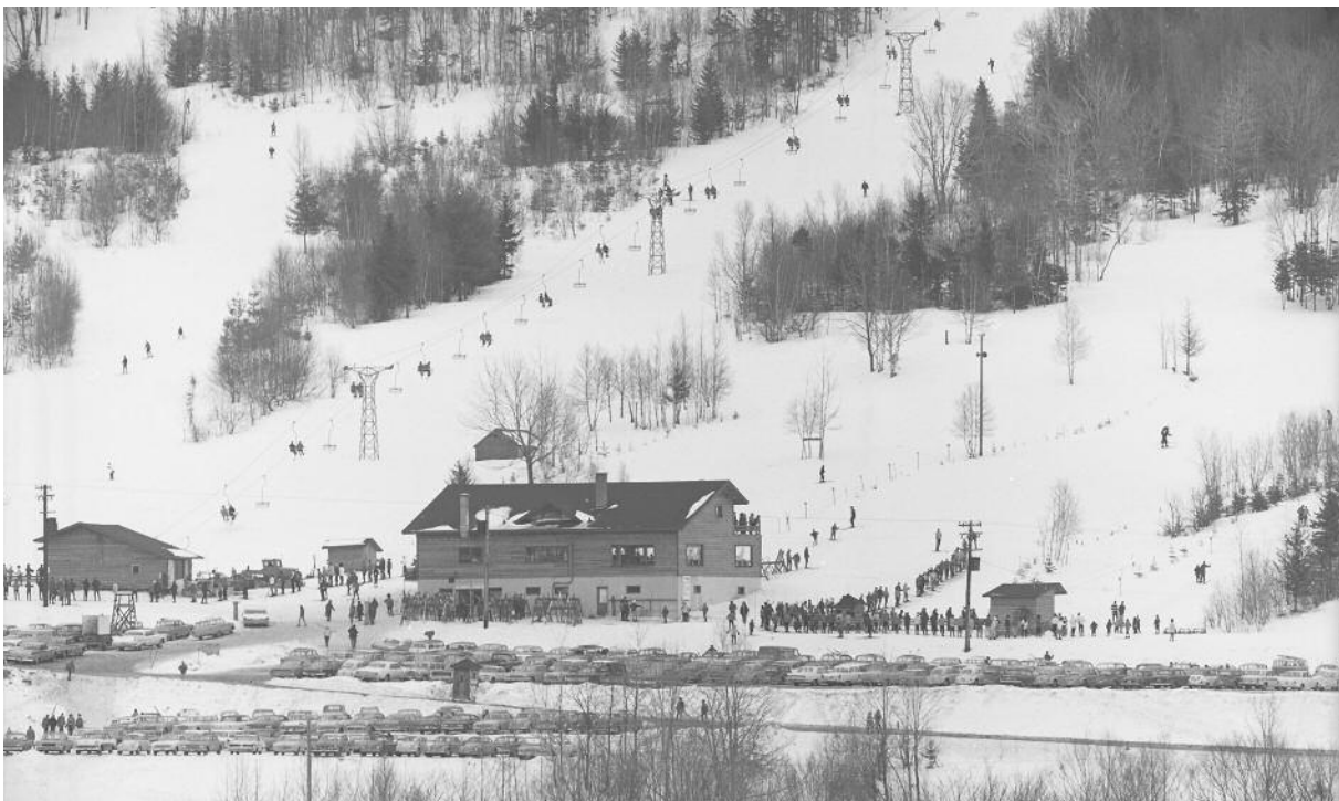
Datée de 1960, la photographie montre, de gauche à droite, le télésiège double de la remontée no 2, le chalet principal, Altitude 400m, ainsi que l'arbalète.