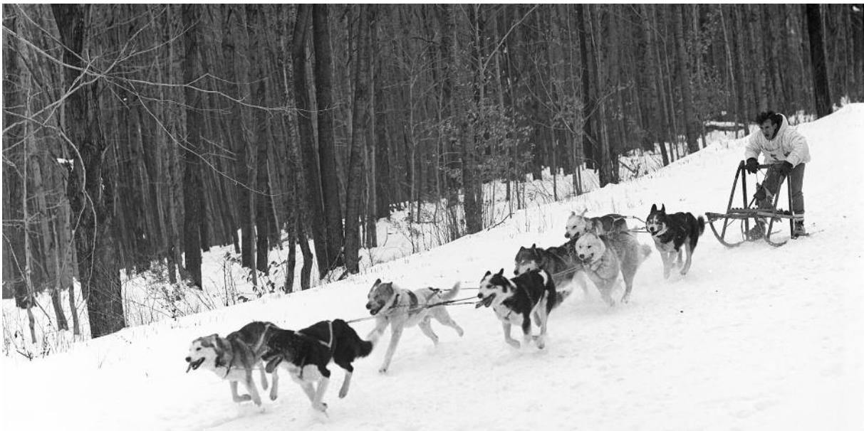
En 1962-1964, des courses d'attelages de chiens avaient lieu à proximité de la station et sur les chemins environnants. Des attelages provenant d'aussi loin que le Yukon y participaient.