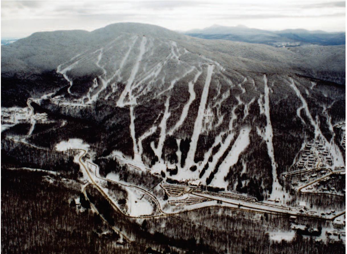
Cette photo aérienne montre la station de ski Mont-Sutton dans son ensemble. Qui aurait pu deviner qu'à partir de ses modestes origines, en considérant la photo en page couverture, elle connaîtrait un si grand succès.