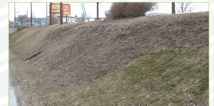
Un exemple de gazon ravagé par les vers blancs.

Mario Bélanger Arboriculteur Ville de Drummondville