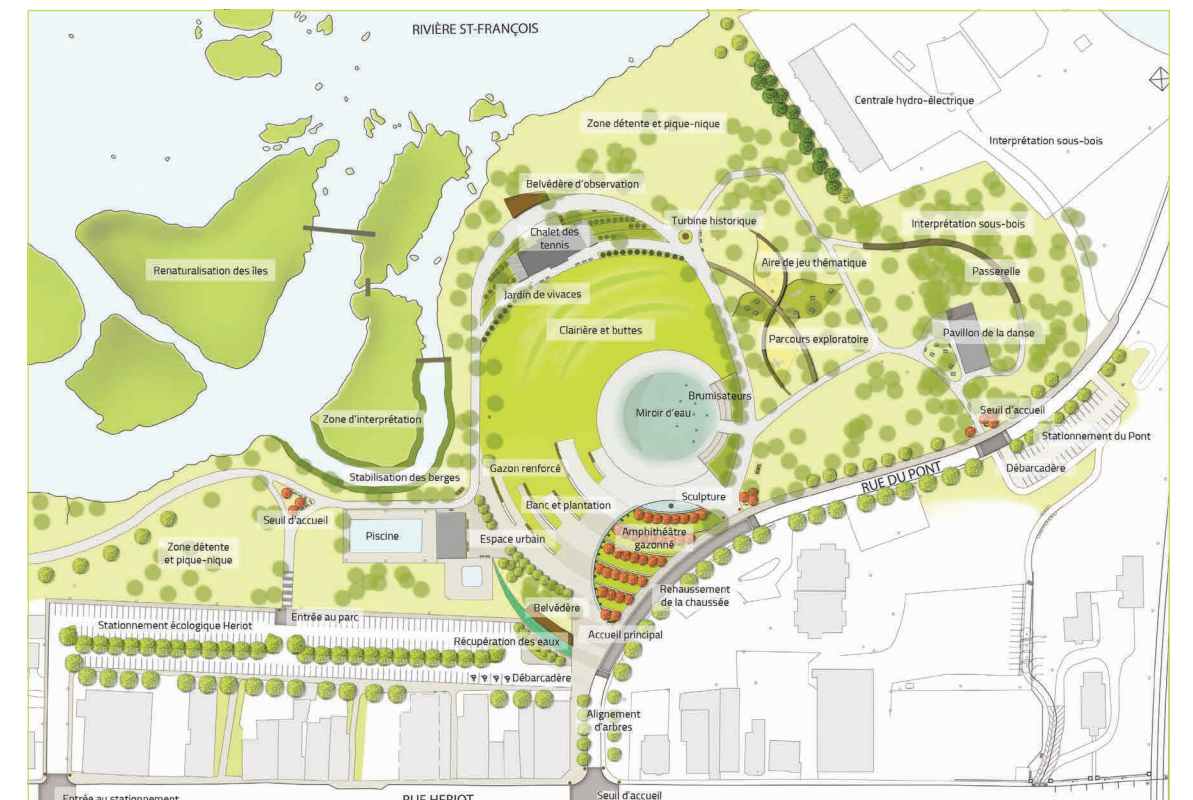
Quels que soient les événements et les saisons, le parc Woodyatt n'aura jamais eu si fière allure au terme des travaux qui s'échelonnent jusqu'en 2015, année du bicentenaire de Drummondville.