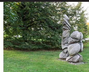
Eva Roucka, Avoir et être , 1993, bois, 233 x 114 x 68 cm

La Galerie d'art Desjardins a été inaugurée en décembre 1978. D'abord connue sous le nom de Centre d'exposition Drummond, elle a changé à quelques reprises d'appellation. Près de 300 expositions ont été présentées dans son espace principal, lesquelles ont attiré plus de 411 000 visiteurs. Son orientation