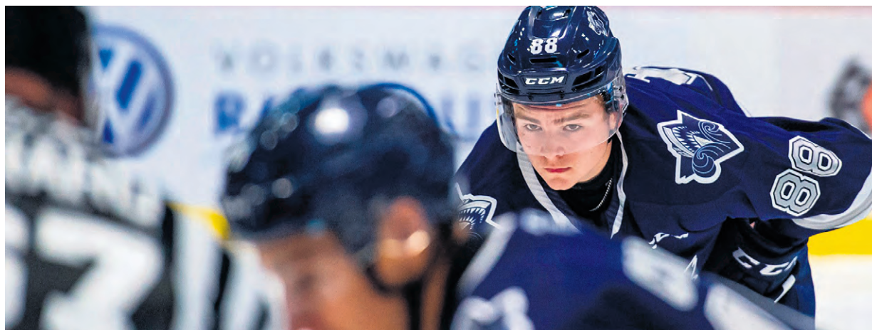
L'organisation rimousoise récidivera avec deux autres parties hors-concours les 8 et 9 septembre à 19 h.