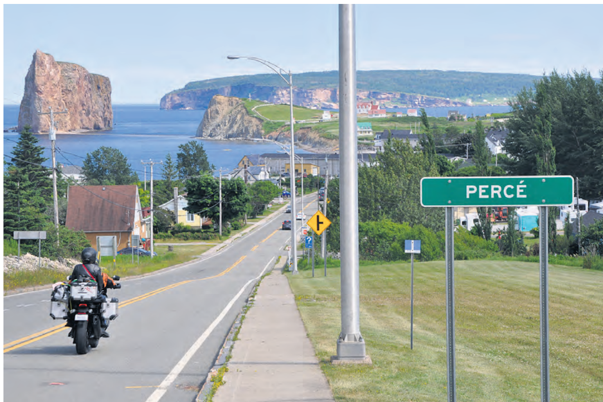
Les audiences ont été faites les 17 et 18 janvier derniers au palais de justice de Percé.