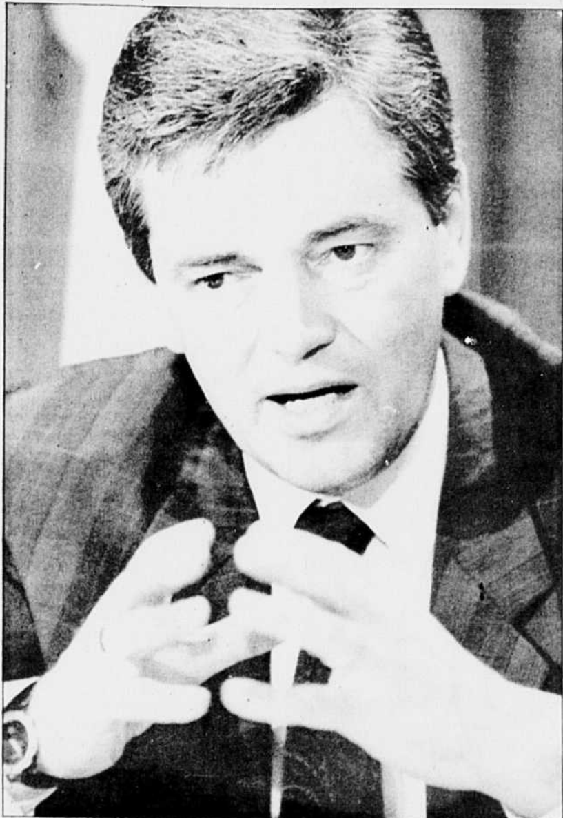
Le ministre de l'Éducation, Michel Pagé