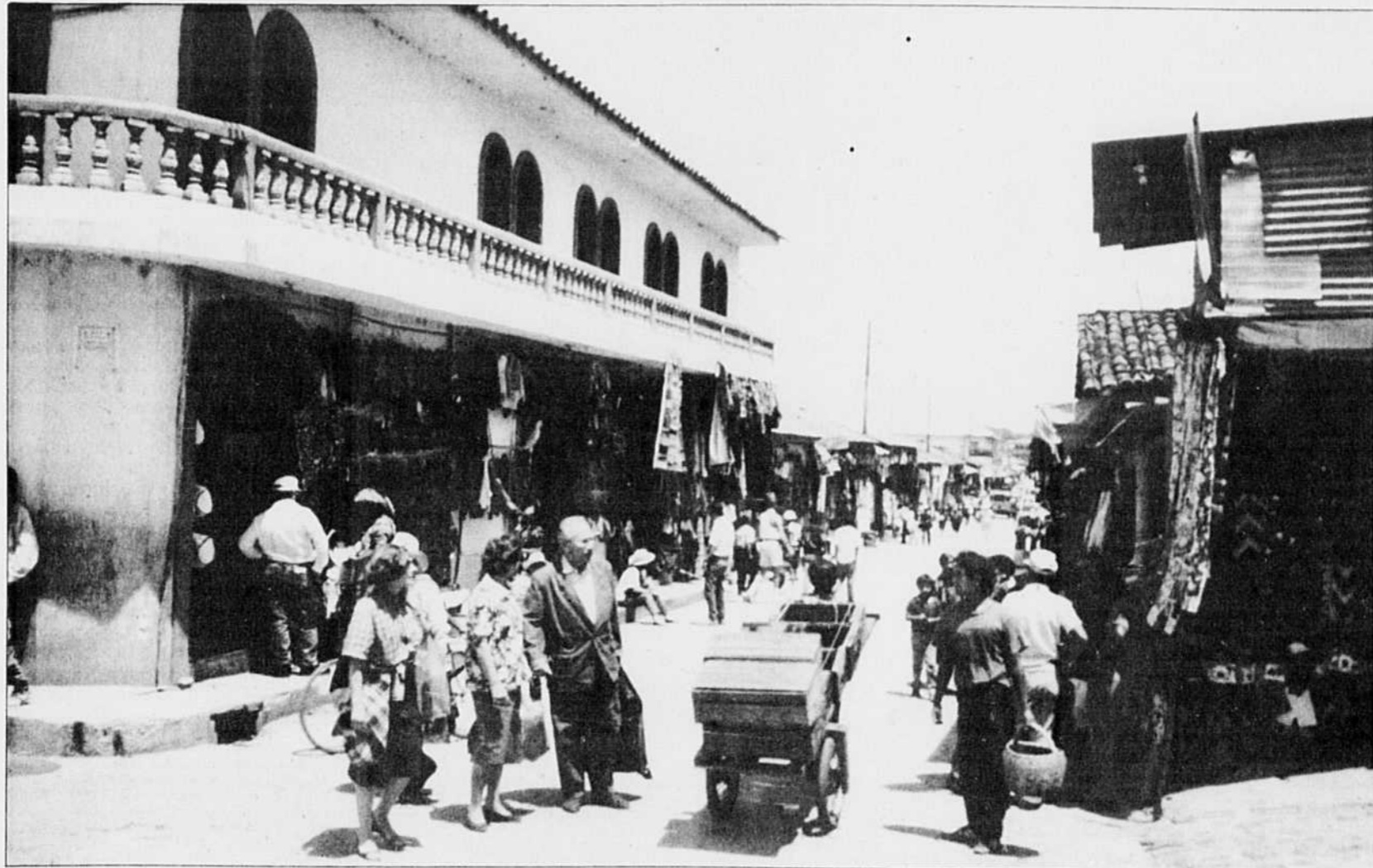
Chichicastenango, une ville du nord-ouest du Guatemala reconnue pour son centre d'artisanat.

Ce printemps, sous l'égide de l'ONU, le gouvernement et le URNG (Unité révolutionnaire nationale guatémaltèque) se sont assis, au Mexique, autour de la table de négociations. Parallèlement, un processus de dialogue national a été entamé avec la participation des divers secteurs sociaux. Leur d'espoir ou simplement une autre illusion dans un