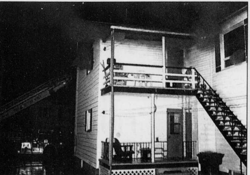
L'intervention rapide d'une douzaine de policiers-pompiers a permis de circonscrire les flammes et d'éviter que l'élément destructeur, qui avait pris naissance au deuxième étage, ne se propage à l'étage inférieur.

Si, hier après-midi, les enquêteurs du Service de la protection publique de Thetford Mines-Black Lake n'avaient