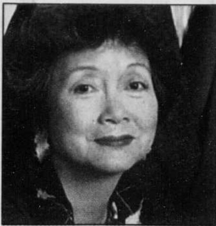
Originaire de Hong Kong, où elle est née en 1939, Adrienne Clarkson deviendra officiellement représentante de la reine au Canada le 7 octobre.

«Le fait de ne pas se trouver mêlée quotidiennement à la vie politique n'empêche pas d'avoir des idées», a dit