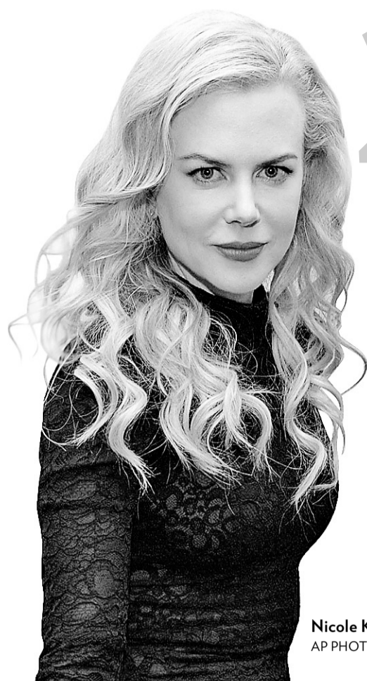
Nicole Kidman

Elle avait fait une fausse couche du temps de sa relation avec Tom Cruise, ce qui l'avait convaincue d'adopter (deux enfants maintenant âgés de 12 et 15 ans), mais voilà que Nicole Kidman, qui a aujourd'hui 40 ans, attend un enfant. Son agente a confirmé la nouvelle plus tôt cette semaine. «Nicole Kidman et Keith Urban attendent un bébé. Le couple est ravi», a-t-elle fait savoir. La rumeur de la grossesse de Kidman avait le vent en poupe depuis que l'actrice avait renoncé au tournage du film The Reader , de Stephen Daldry, qui doit commencer ce mois-ci. On ne sait pas si Tom Cruise se réjouit de la bonne nouvelle, mais une chose est sûre, cet enfant à naître ne sera pas celui de Ron L. Hubbard, le fondateur de l'Église de scientologie, dont le sperme congelé aurait servi à la conception de la célèbre Suri Cruise Holmes... du moins s'il faut en croire la biographie à paraître d'Andrew Morton.