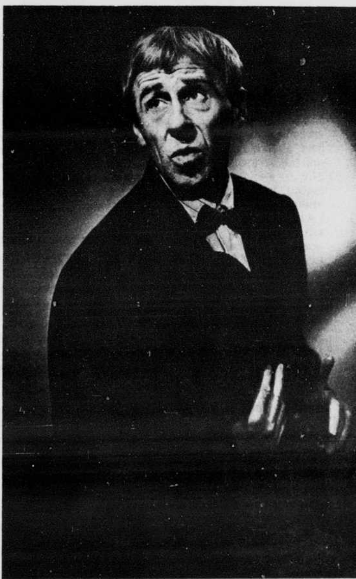
Gratien GELINAS (« Bousille »)

Extraits du Journal de Julien Green ..... p. 64