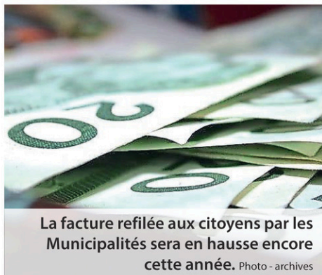
La facture refilée aux citoyens par les Municipalités sera en hausse encore cette année.

À Scott, l'augmentation moyenne du taux de taxes sera de 1,5%. L'augmentation du service des ordures, afin de couvrir les augmentations annoncées pour la cueillette et l'enfouissement, sera de 10$ pour une résidence. La Municipalité planche actuellement sur un projet d'agrandissement de l'usine d'eau potable et l'acquisition d'un camion autopompe. Le projet de requalification de l'église est toujours d'actualité.