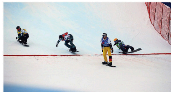
Éliot Grondin franchissant la ligne d'arrivée en 3 e place.

Grondin est maintenant quatrième au classement général de la Coupe du monde avec un total de 214 points. Martin