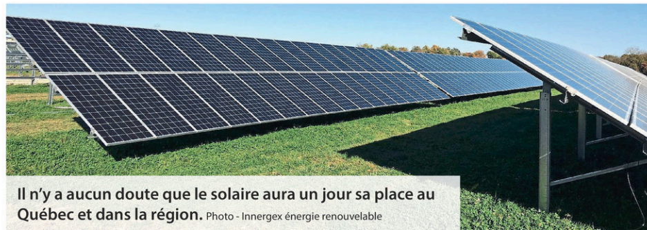
Il n'y a aucun doute que le solaire aura un jour sa place au Québec et dans la région.