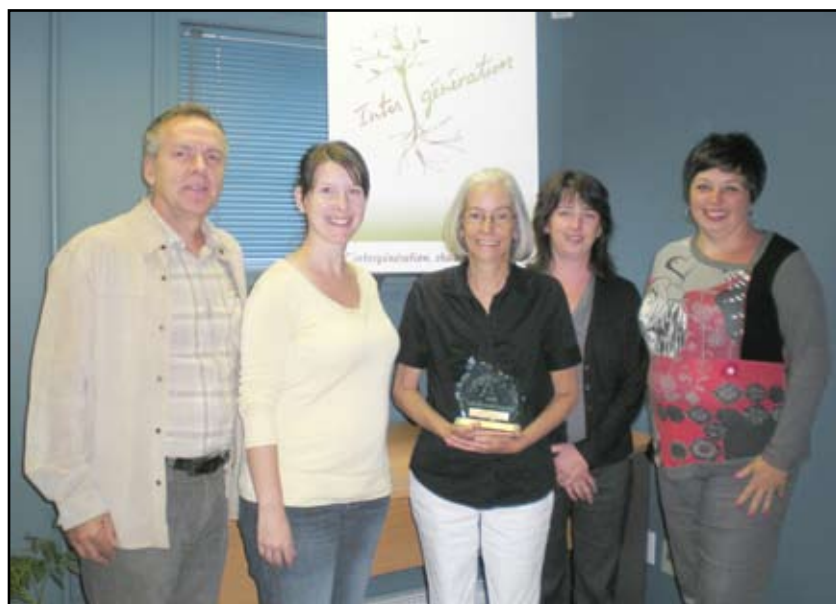
Comité intergénération de la MRC du Granit