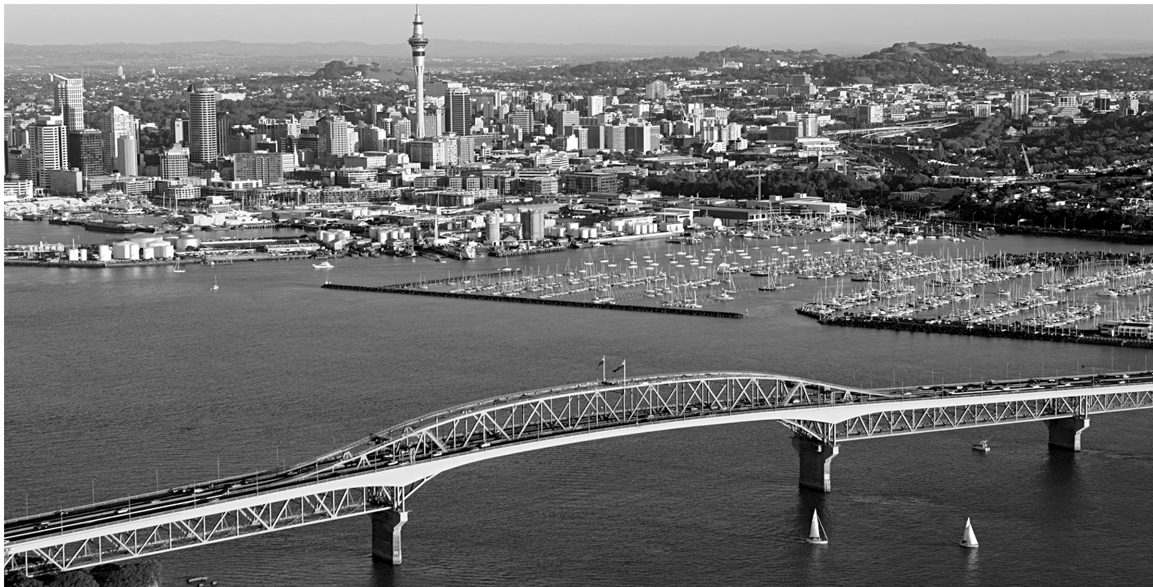
Le pont Akl Harbour d'Auckland.