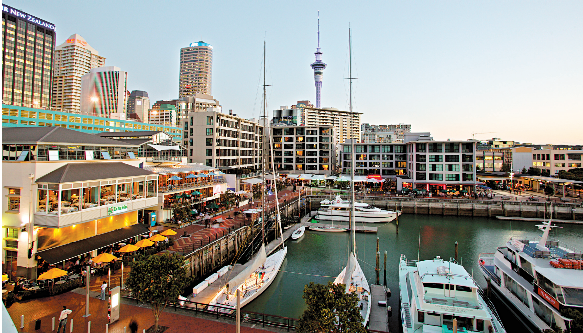
Le Viaduct Harbour d'Auckland.