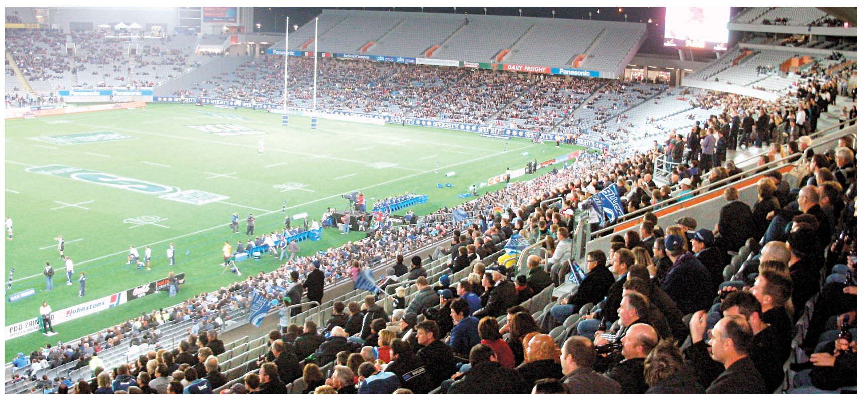
Le stade d'Eden Park à Auckland, où se déroulera la finale de la Coupe du monde de rugby.

Ce haka aurait été créé par le chef Te Rauparaha, poursuivi par une tribu adverse et obligé de se cacher. Depuis, Ka mate — «Je meurs» — et