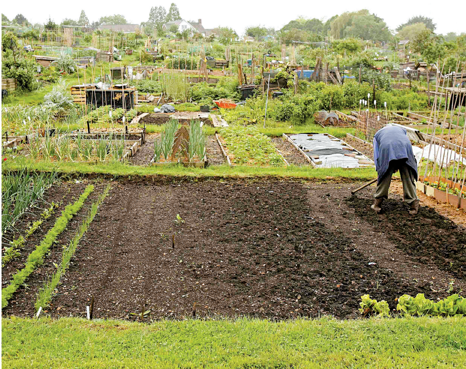
ALESSIA PIERDOMENICO REUTERS