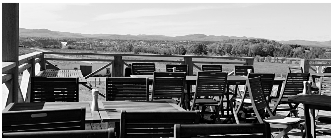
La terrasse du Panache Mobile, qui donne sur le vignoble, s'ouvre au loin sur la chute Montmorency et le paysage montagneux.