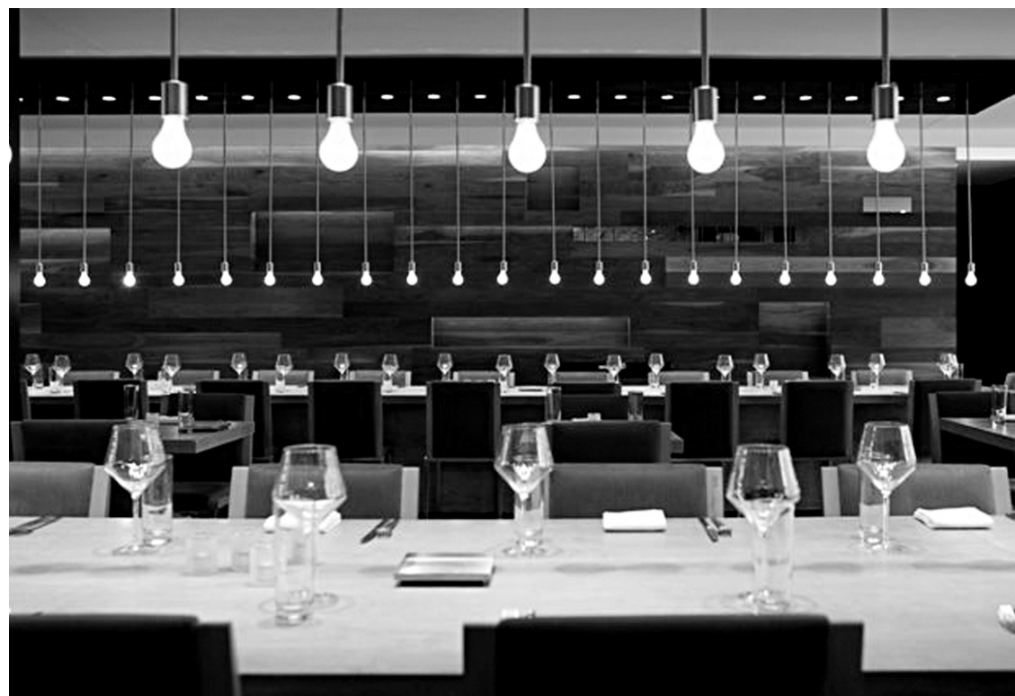
L'aménagement convivial du restaurant Table à Québec comporte deux longues tables communes où les clients peuvent socialiser et échanger, et d'autres individuelles pour les repas plus intimes.

Quelques-uns de ces plats sont aussi disponibles en com-