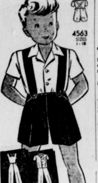
Patron No 4563. — Voici un ensemble pratique pour votre garçonnet: pantalon à bretelle et petite blouse, tailleurs les deux faciles à confectionner. Un patron de salopette est également inclus dans l'enveloppe du patron.

AVIS AUX MEMBRES DU Sherbrooke Country Club Inc. Les membres de ce club sont avisés que la maison du club sera définitivement fermée pour la saison d'été. Le prochain dans l'après-midi, R. V. P. démanteler tout ménage personnel. 194-2 VENTE d'économie à la salle de l'église Plymouth, mercredi et jeudi, les 24 et 25 octobre, 1945 à 10:45 a.m. à 5 p.m. Pour détails, téléphones 113. À cause de circonstances imprévues et du retard de plusieurs rapports la campagne de la "Maison du Souvenir" de la Légion canadienne est officiellement prolongée jusqu'au 21 novembre. Souvenez-vous généreusement. RETRAITES FERMÉES à la Villa Notre-Dame du Saint-Sacrement: du 19 au 21 oct. pour la J. O. C. P.; du 22 au 25 oct. pour dames; du 26 au 28 oct. pour jeunes filles; du 29 oct. au 1er nov. retraite masculine pour dames et célibataires; du 2 au 5 nov. pour dames Titulaires de partout. Prière de donner son nom à l'avis à la Villa, 12 Avenue Bellevue, Sherbrooke. J.N.O.