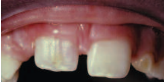
Figure 4a - Dyschromie coronaire de la dent 1.1