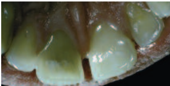
Figure 1b - Coloration brunâtre au lingual de la dent 1.1