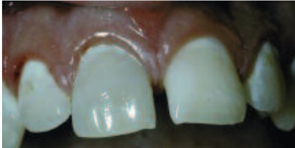
Figure 1a - Coloration grisâtre de la dent 1.1