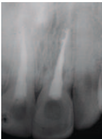
Figure 2 - Résorption de remplacement sur la racine de la dent 2.1