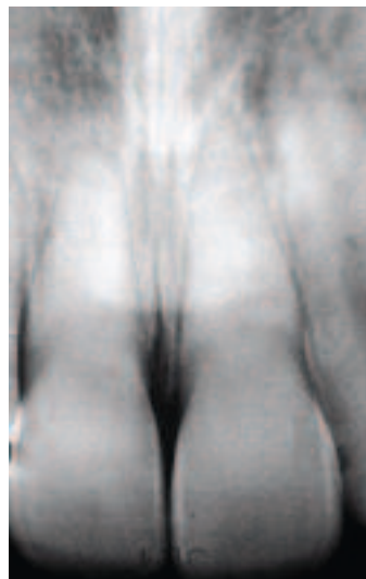
Figure 5b - Oblitération canalaire complète des dents 1.1 et 2.1