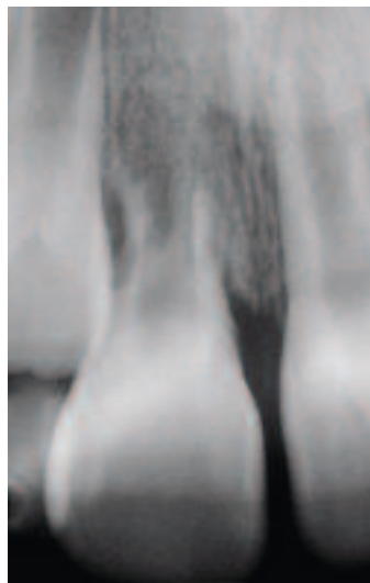
Figure 3 - Résorption inflammatoire sur la racine de la dent 1.1