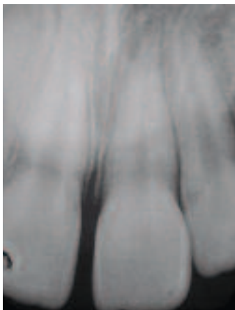
Figure 5a - Oblitération canalaire partielle de la dent 2.1