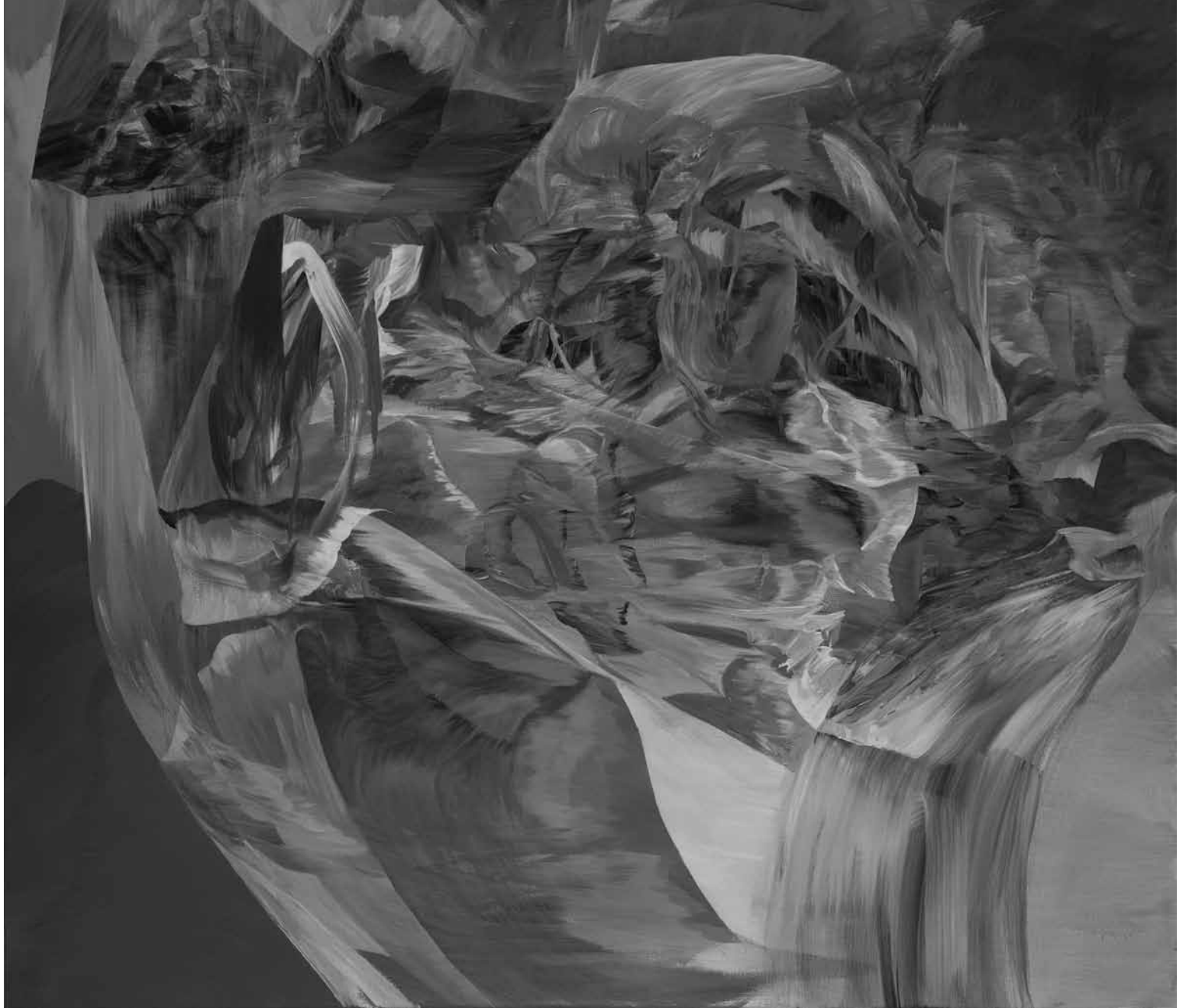
MELANIE AUTHIER Zodiac Mansion , 2017 Acrylique sur toile 106 x 122cm Acquisition en cours.