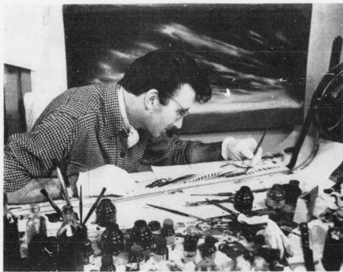
Des gants pour éviter les empreintes des doigts, une loupe, des plumes et des pinceaux auxquels s'ajoute le sens créateur et une patience inépuisable!