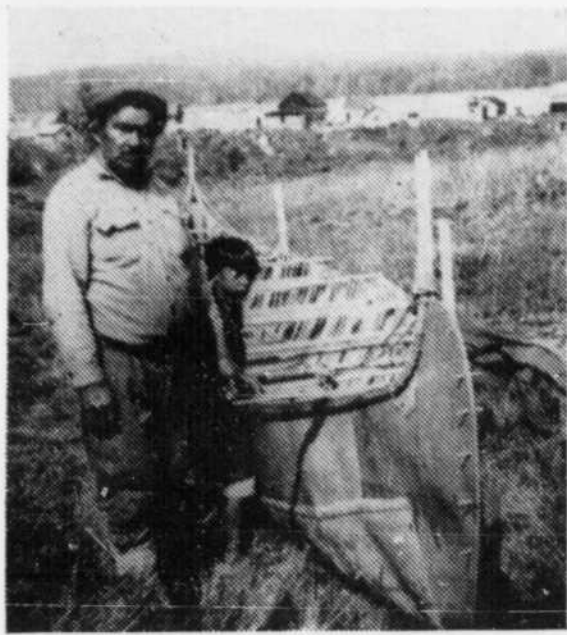
Boys aid their sires by portaging loads, building canoes...

Political Life. Women have no recognized place in the political life of the band. They had no positions in the tribal councils, which are, in fact, mere artificial bodies introduced to the tribe by the Indian Affairs Branch and have not a great deal of influence inside the band. Female chiefs are unknown. However, as has already been indicated, women have an indirect voice in tribal politics, working through their husbands.