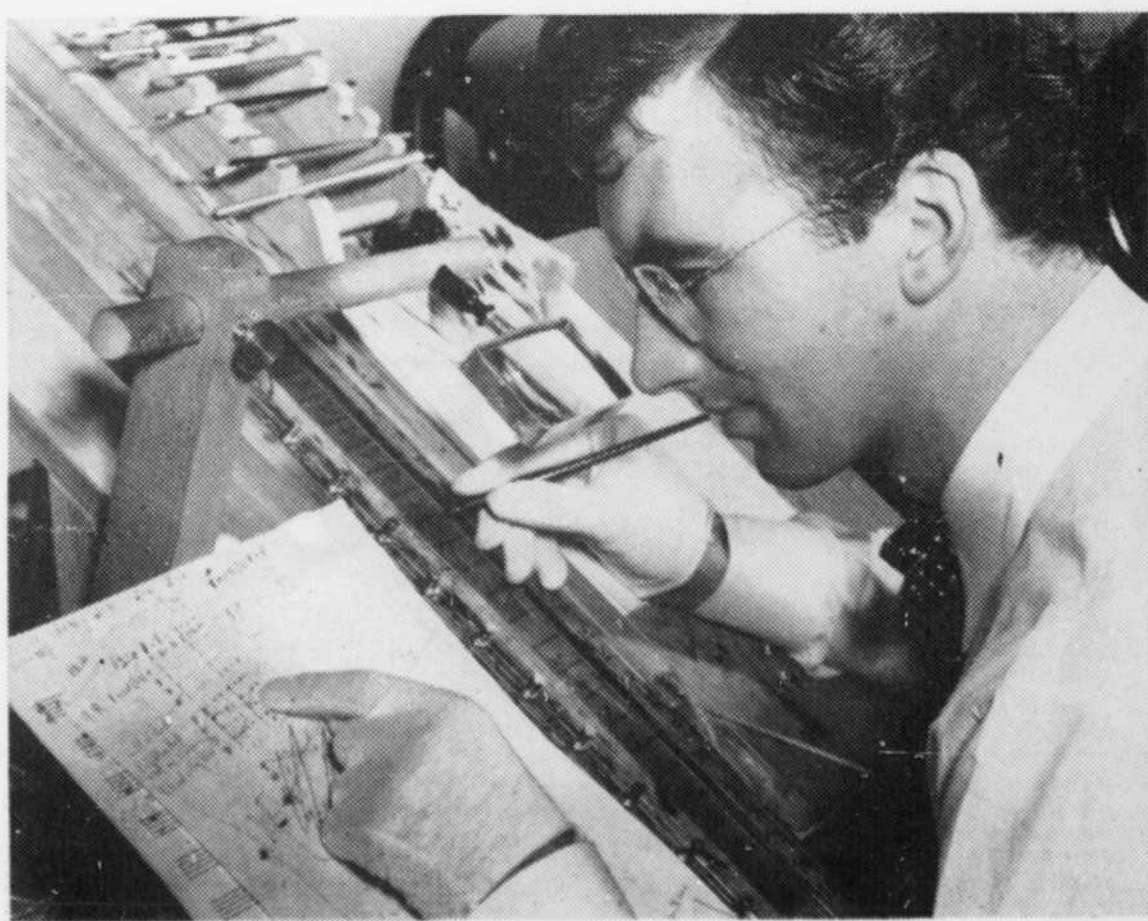
D'un côté la piste sonore, de l'autre la piste visuelle! Après avoir appris à lire la première, l'auteur est en train de produire la seconde, de sorte que le rythme et la forme s'agent parfaitement pour ne former qu'une seule et même expression...

Et j'écoute parler ce jeune homme timide, cravates en boucle, figure ronde, lunettes rondes pour qui l'art n'est pas une affaire à compartiment; un Américain qui n'est pas des Etats-Unis; un cinéaste qui n'est pas de Hollywood; un auteur d'animation qui ne se revendique pas de Walt Disney, bref, un Canadien qui réalise du cinéma d'avant-garde pour la masse des spectateurs!