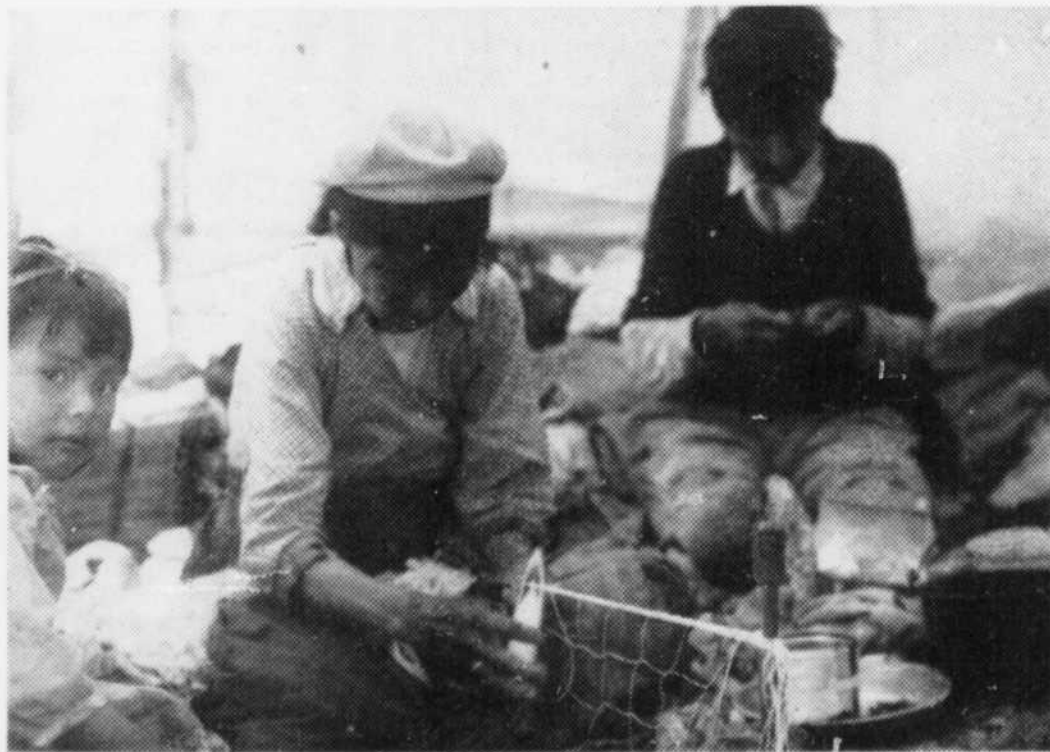
Girls assist their mothers in the routine of the home, such as making fishing nets.