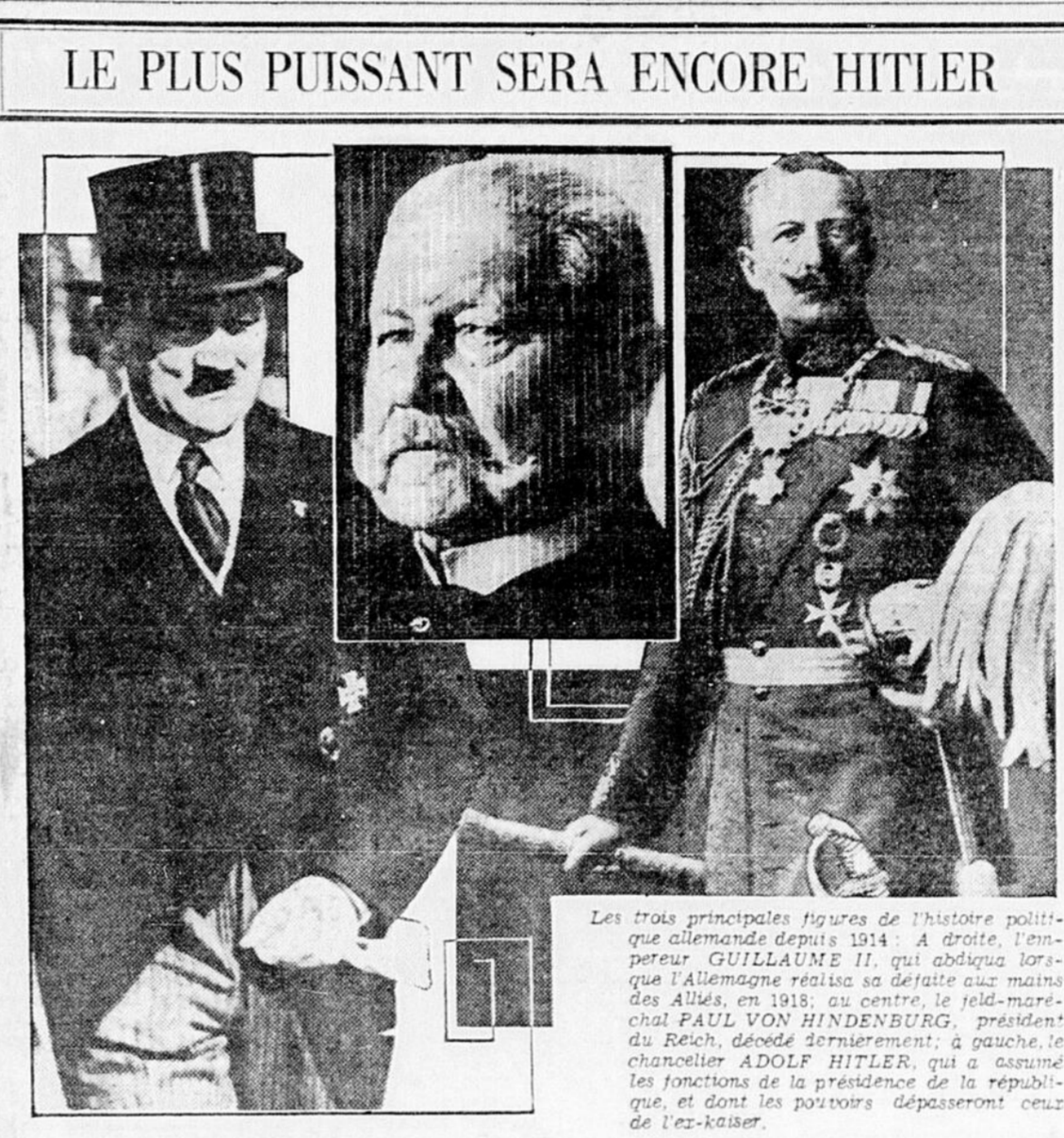
Les trois principales figures de l'histoire politique allemande depuis 1914. À droite, l'empereur GUILLAUME II, qui abdiqua lors de l'Allemagne réalisa sa défaite aux mains des Alliés, en 1918; au centre, le feld-marschal PAUL VON HINDENBURG, président du Reich, déposé d'armement; à gauche, le chancelier ADOLF HITLER, qui a assumé les fonctions de la présidence de la République, et dont les pouvoirs dépasseront ceux de l'ex-empereur.

(Serv. de la Presse Canadienne) Toronto, 9. — Le Mail and Empire annonce aujourd'hui que si les plans actuels d'un "groupe politique intéressé" se matérialisent, l'association conservatrice de l'Ontario annoncera probablement pour le mois d'octobre une convention au cours de laquelle on choisira un nouveau leader. La convention d'après le journal, jettera aussi les bases d'un nouveau programme dans les rangs conservateurs.