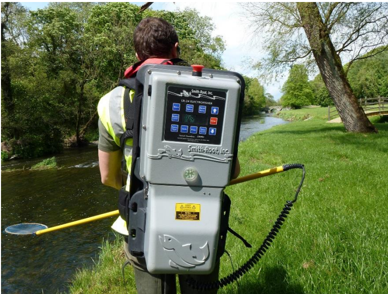
b) Appareil portatif, alimenté par des batteries