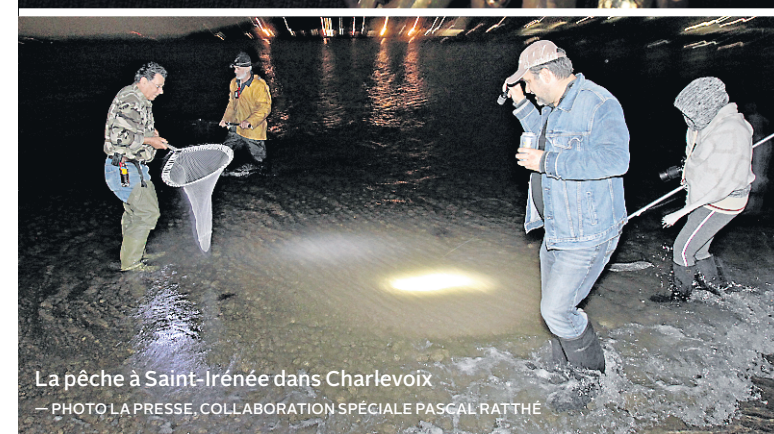
La pêche à Saint-Irénée dans Charlevoix