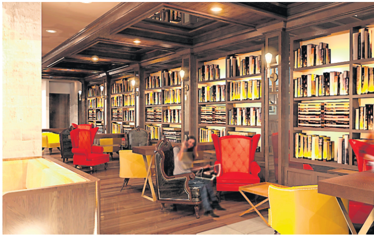
Le coin bibliothèque du nouvel hôtel-boutique du Vieux-Montréal, le William Gray