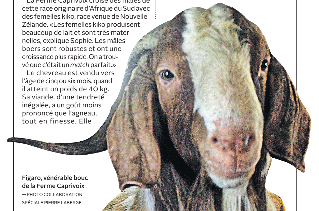
Figaro, vénérable bouc de la Ferme Caprivoix