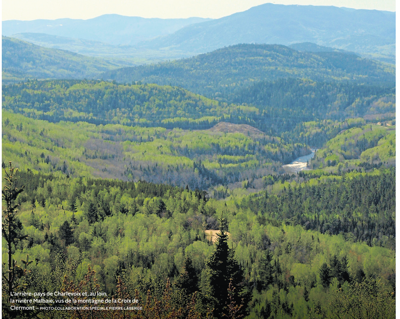
L'arrière-pays de Charlevoix et, au loin, la rivière Malbaie, vus de la montagne de la Croix de Clermont

Le nom de Charlevoix évoque bien sûr le Saint-Laurent, le «chemin qui marche», comme l'appelaient les Micmacs, fleuve nourricier à la splendeur toujours changeante, habitat d'une faune incroyablement riche. On oublie trop souvent l'arrière-pays et ses collines verdoyantes, qui abritent des fermes parmi les plus jolies du pays. Entre prés et marées, tradition et nouveauté, nous vous proposons une sorte de surf and turf au cœur de l'une des plus anciennes destinations de villégiature du Québec. PAGES V4 À V6.