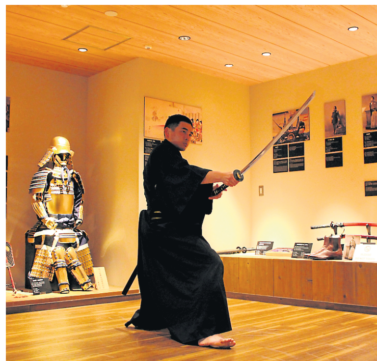
Jeunes et moins jeunes vont adorer les démonstrations de maniement d'armes au Musée du samouraï.

Pour faire plaisir à vos enfants et comprendre vraiment ce que signifie la culture kawaii («mignon» en japonais), rendez-vous à Kiddyland, le plus emblématique des magasins de jouets tokyoïtes. La boutique située avenue Omote Sando, à Harajuku, s'étend sur cinq étages et propose une multitude d'articles, de jouets, de peluches, de figurines et de produits dérivés de différentes franchises. En plus des Stars Wars, LEGO, Peanuts et autres produits Disney, on trouve de célèbres personnages japonais qui ont traversé (ou pas) les frontières, comme Hello Kitty, Pompompurin, Doraemon ou Miffy, et qui sont déclinés sous toutes leurs formes et en