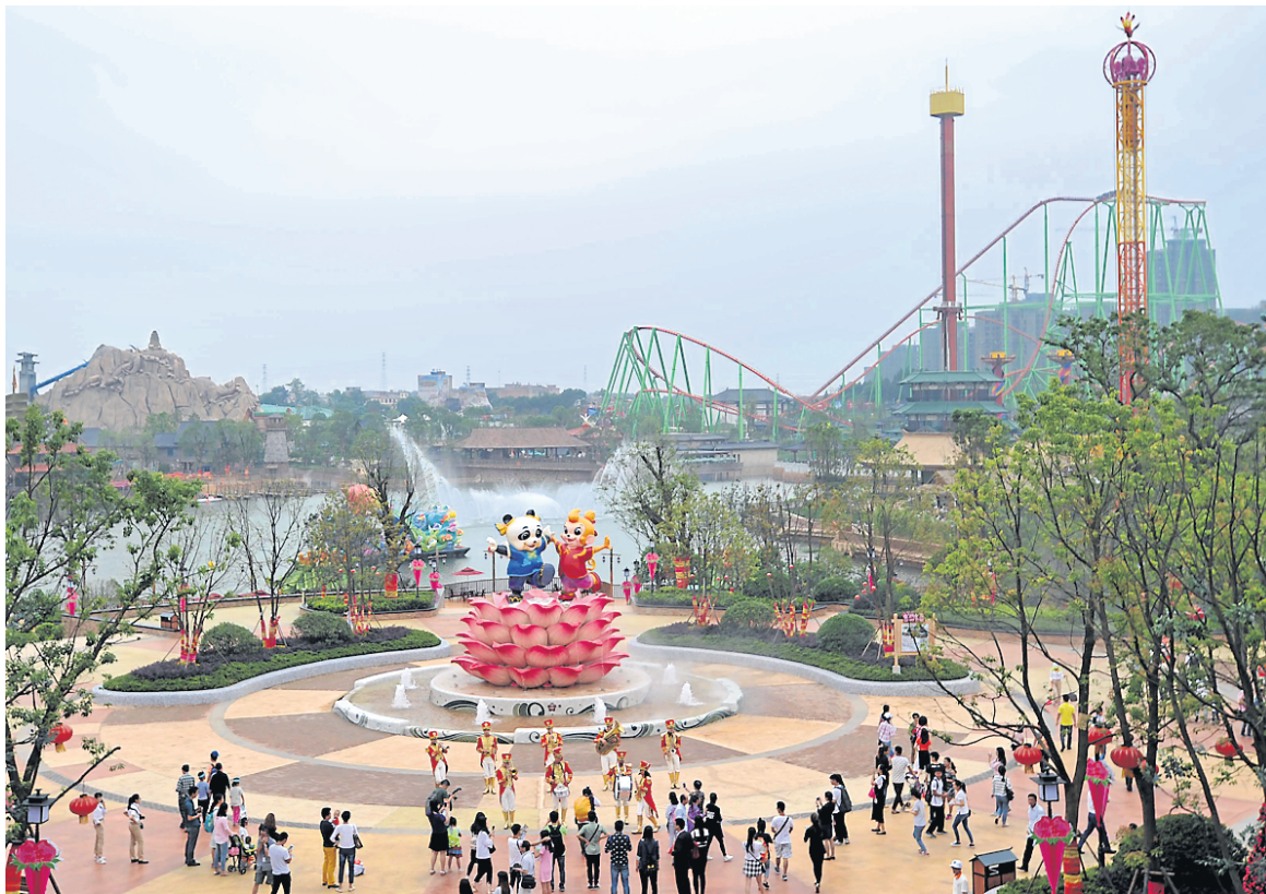
Le parc d'attractions Wanda City a ouvert ses portes à Nanchang, ville de la province chinoise de Jiangxi, la fin de semaine dernière.

De fait, les prix élevés imposés par Disney ont été largement critiqués par les internautes chinois sur la plateforme de microblogage Weibo.