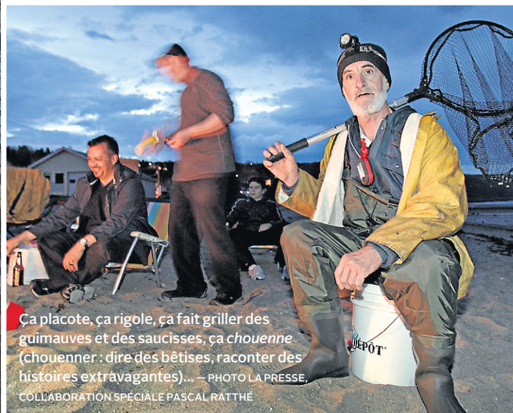
Ca placote, ça rigole, ça fait griller des guimauves et des saucisses, ça chouenne (chouenner : dire des bêtises, raconter des histoires extravagantes)...

l'évocation de cette pêche extraordinaire. «Ouais. Dire que, la semaine dernière, on en a pris 104, à 4 gars, et il a fallu aller les chercher loin, loin là-bas», dit-il en montrant du doigt une langue de sable découverte par le jusant. Cent quatre poissons, misère. Et on dirait bien que ce ne sera pas meilleur aujourd'hui. Mais ça semble ne décourager personne.