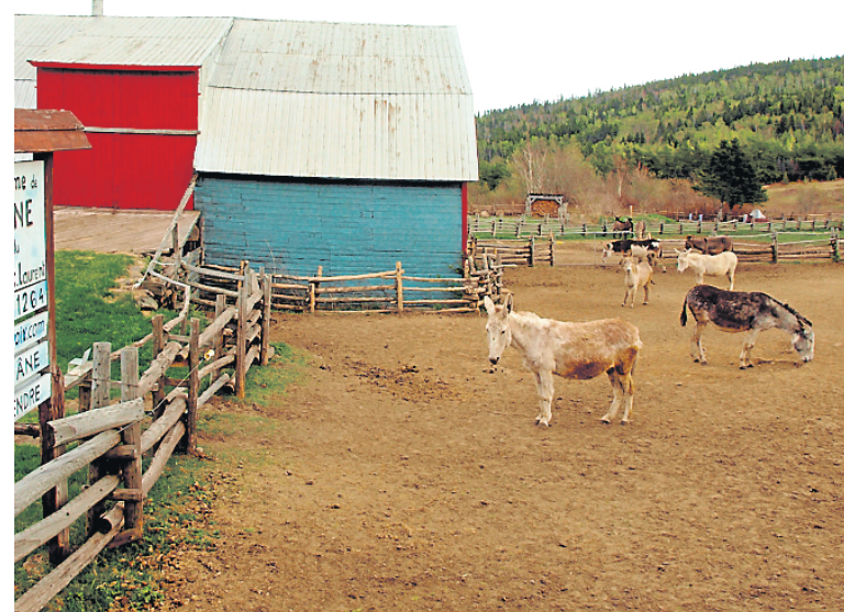
La ferme de l'âne du Saint-Laurent, à Port-au-Persil, où l'on peut se procurer les produits Shamâne.