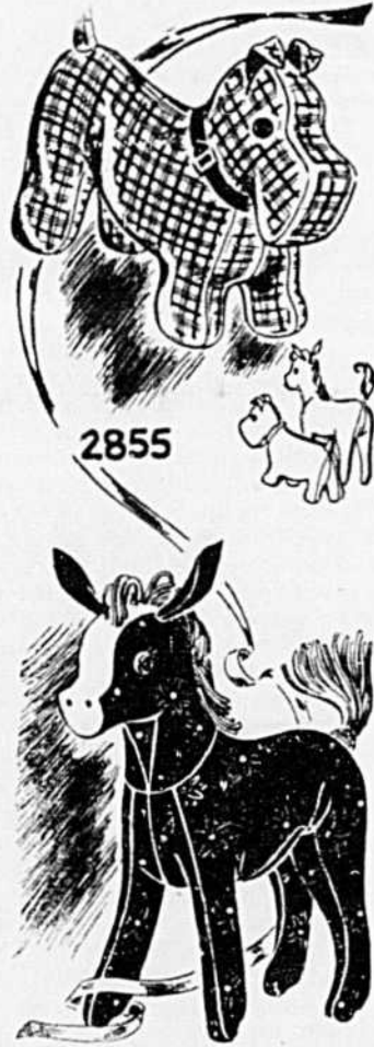
Patron 2855F — Un amusant toutou qui aura bonne mine, en robe d'indienne ou de velours, de caracul ou de feutre.

L'année 1942 marque le centième anniversaire de naissance de Calixa Lavallée, l'auteur de l'hymne national "O Canada".