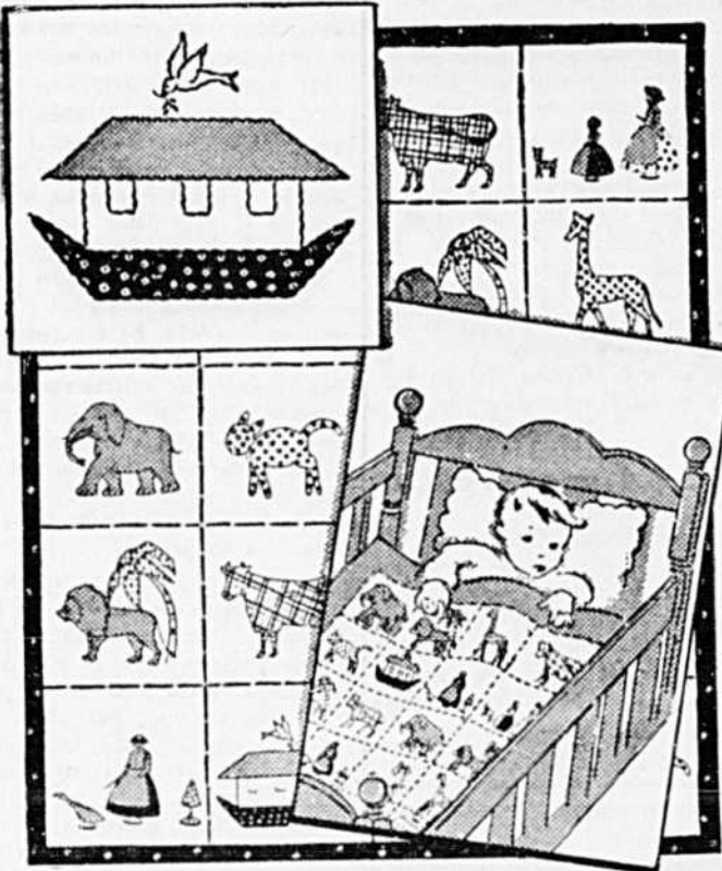
Quoi de plus joli pour un couvre-pieds d'enfants ou de poupée? L'arche de Noé avec les petits animaux dont l'histoire endormira bien les tout petits.

(L'Offrande aux Vierges folles) Alfred DESROCHERS