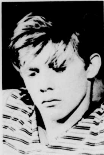
GEORGES POUJOULY est la vedette du "Lion amoureux", à l'affiche des «Fables de La Fontaine», à la télévision, samedi à 9 h 30 du soir.