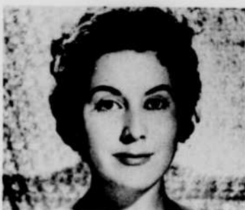
Lisa della Casa

L'émission musicale Bel canto se propose de vous faire connaître et apprécier les plus belles voix du monde. Au cours de l'émission qui sera diffusée le mardi 11 juillet à 8 heures du soir, vous entendrez Lisa della Casa.