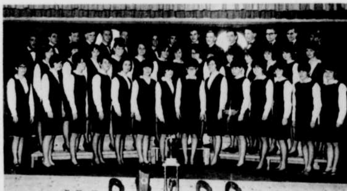
Chorale de Grand-Digue

Cette émission qui nous parvient de Moncton est une réalisation de Pierre Leblanc.