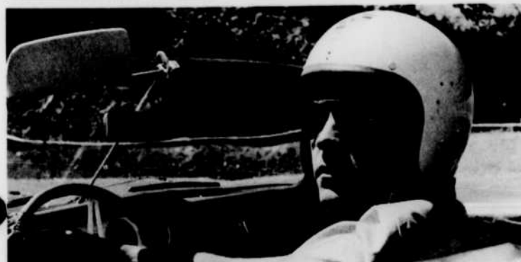
"Prenez le volant", avec JACQUES DUVAL, chaque vendredi à 8 heures.