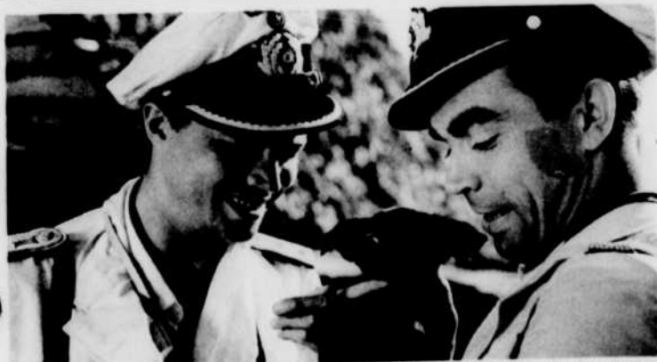
Scène du film PATROUILLE DANS LE PACIFIQUE, à l'affiche de la chaîne française de télévision, le mercredi 12 juillet à 1 h 30 de l'après-midi.