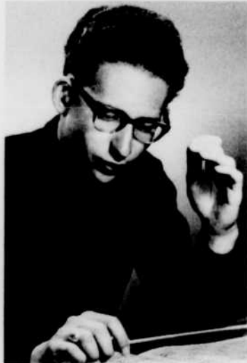
BORIS BROTT, accompagné de dix-sept jeunes musiciens, parlera de la direction d'orchestre, à «Jeunesse oblige», mardi à 6 heures du soir.