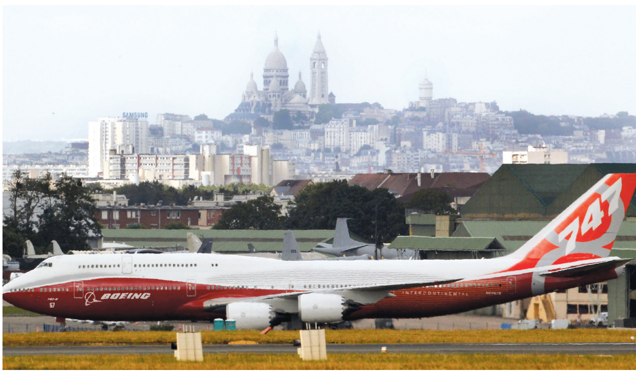
Le nouveau Boeing 747-8 sur le tarmac du Bourget, près de Paris. En arrière-plan, on peut apercevoir le Sacré-Cœur dans les hauteurs de la Ville lumière.

Côté québécois, les quatre grands acteurs sont là: Bombardier, Pratt & Whitney, Bell Hélicoptère et CAE Electronique. Les regards se tourneront surtout vers Bombardier et sa C-Series, sa nouvelle gamme d'appareils de 110 à 130 places dont l'avenir a suscité des inquié-