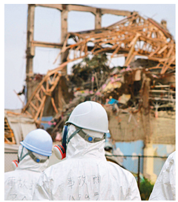
Des membres du gouvernement japonais mènent l'enquête devant les débris de la centrale nucléaire Fukushima-Daiichi.