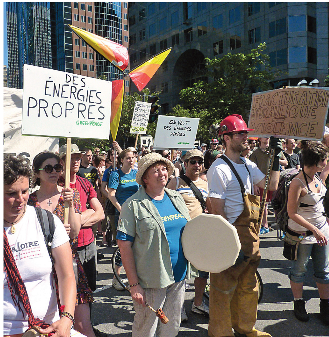
Brandissant des pancartes et entonnant des chansons sur le thème des gaz de schiste, des milliers de manifestants ont voulu rappeler à la population et surtout au gouvernement du Québec que rien n'est réglé dans ce dossier.