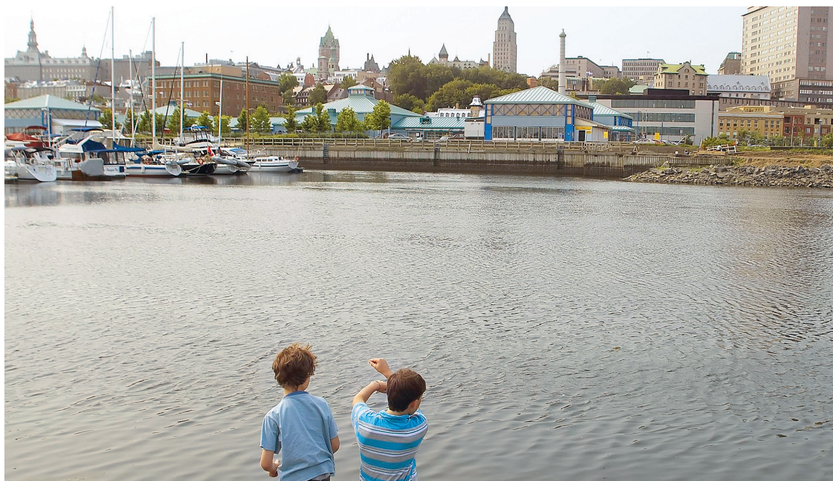
CLÉMENT ALLARD LE DEVOIR

Le gouvernement fédéral américain reçoit davantage en taxes des touristes à Miami Beach que ce qu'il lui en coûte pour entretenir les plages de l'ensemble du pays. Pour la Floride, chaque dollar