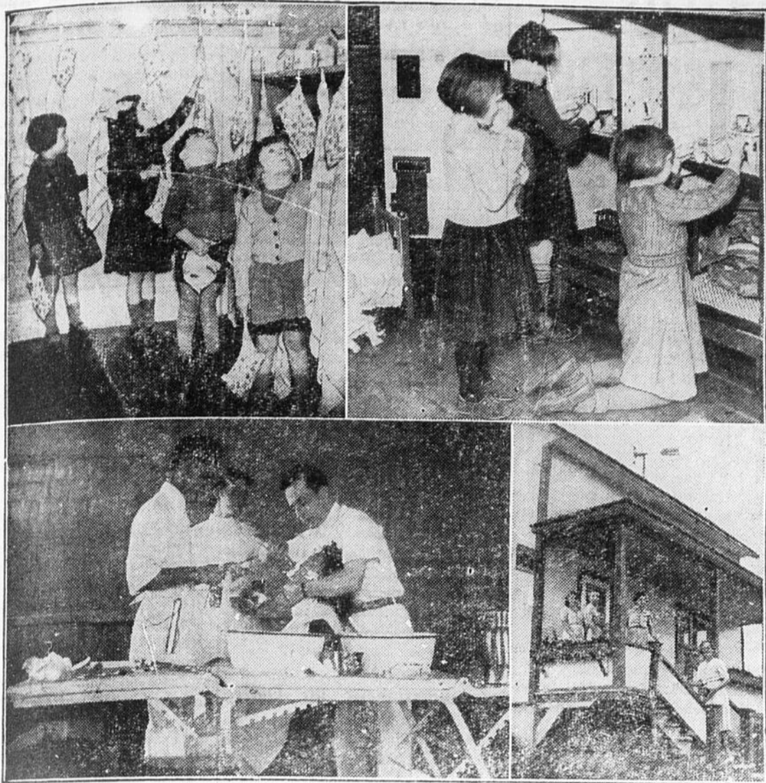
La guerre n'empêche pas la Croix-Rouge de continuer ses oeuvres humanitaires dans la province de Québec. L'an dernier, deux de ses cliniques médico-dentaires ont traité gratuitement plus de 8,000 colons de l'Abitibi et du Témiscamingue. Le ministère provincial de la Santé collabore étroitement avec les médecins, dentistes et infirmières des cliniques de la Croix-Rouge.

La Croix-Rouge se montre également généreuse pour les orphelins anglais à qui elle donne des vêtements et les soins médicaux. Cette année, la Croix-Rouge de la Jeunesse (division de la province de Québec) versera $28,000 pour l'entretien de huit orphelinats en Grande-Bretagne.