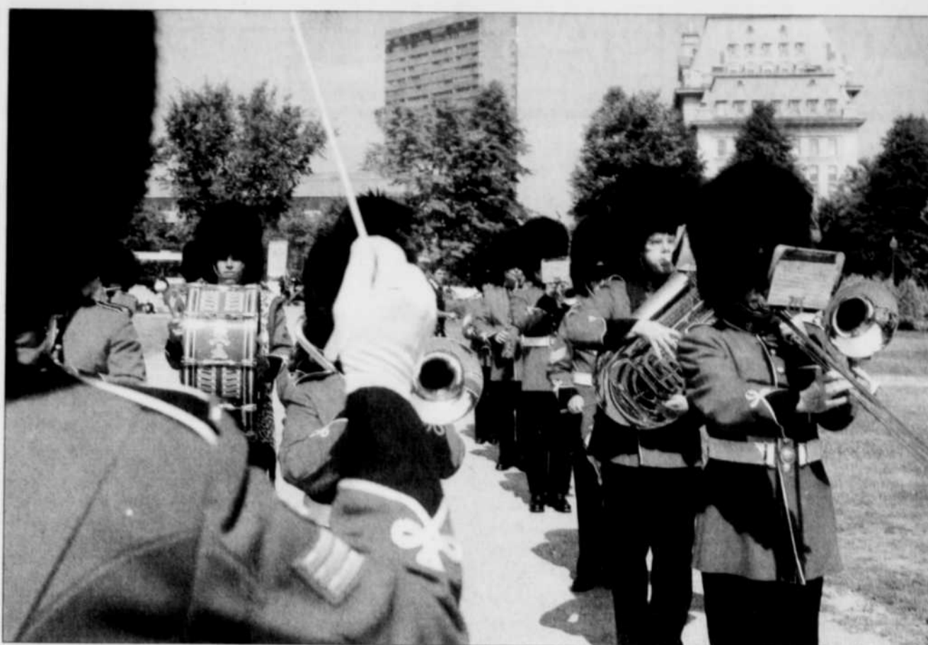
Pour sa septième année d'existence, le Festival international de musiques militaires de Québec reçoit quelque 600 musiciens en provenance du Canada et des États-Unis.

Outre les pré-événements et les deux spectacles gratuits du 10 septembre, tous les concerts d'Envol et Macadam sont accessibles à des coûts s'échelonnant de 5 $ à 17 $.