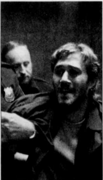
Roy Dupuis dans « L'Exécution »