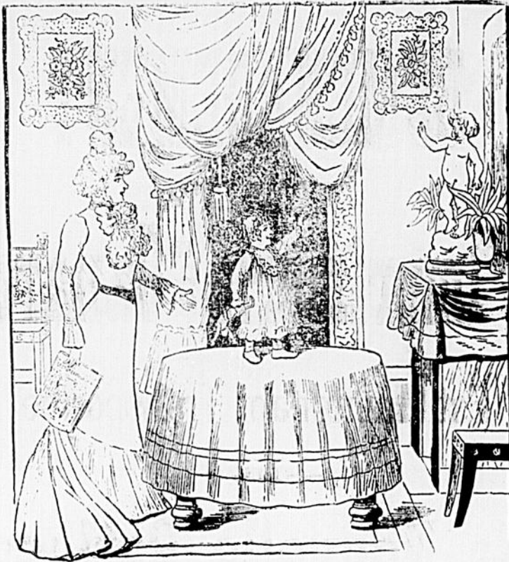
LA MAMAN. — Regarde ce petit enfant sur la cheminée, il ne désobéit jamais, lui; ce n'est pas comme toi. LE BÉNÉ. — Eh ben! fallait m'acheter en plâtre, comme la statue.