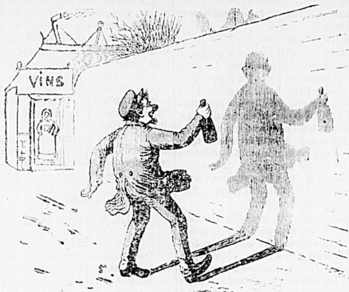
ETIENNE passablement en brosse).—Réponds-donc, eh ! puisque je veux trinquer avec toi !

—C'est ça tu plains Médor ; mais tu ne me plains pas moi qui suis enchaîné dans le mariage de plus vingt-neuf ans.