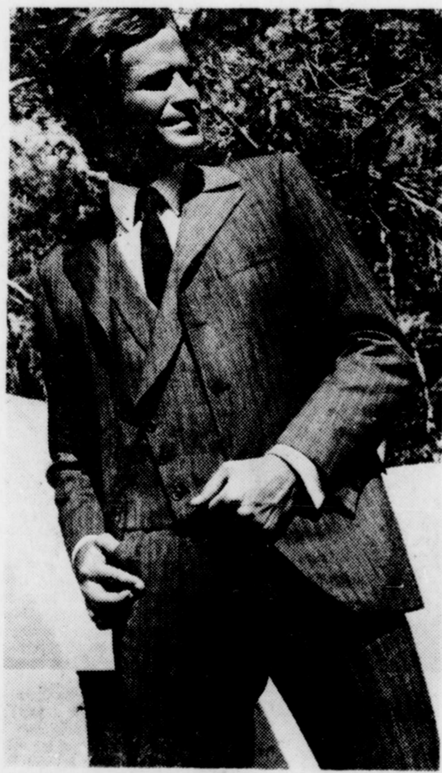
DES RAYURES POUR LES MESSIEURS. Si les femmes deviennent trop féministes, qui aidera ces Messieurs à s'habiller, de grâce Mesdames, n'abandonnez pas ceux d'entre eux qui n'ont aucun goût... pour les autres, depuis longtemps ils savent se passer des femmes et s'en tirent à merveille, pourquoi se le cacher?

Le lavage des murs et des boiserie se fait rapidement et sans effort avec une solution de soude qui enlève aussi radicalement la pellicule grasseuse et la poussière que les taches les plus rebelles.