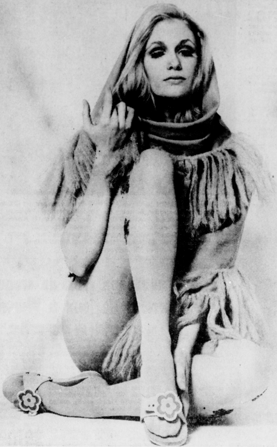
IL Y A MILLE FAÇONS... de porter le châle, mais celle illustrée ici n'est pas à recommander pour la rue. A la plage, vous pouvez toujours, mais lorsque le mercure

descend, il faut couvrir un peu plus que proposé sur cette photo. N'êtes-vous pas d'accord, madame?