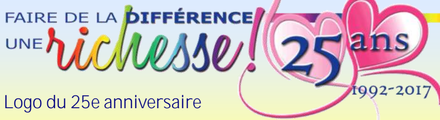
Logo du 25e anniversaire

Pour promouvoir le 25 e anniversaire de L'Arc-en-Ciel RPPH, nous mettrons en avant notre slogan « Faire de la différence une richesse » qui sera accompagné de cœurs entrelacés. Ces cœurs représentent l'union de nos forces et de nos différences dans la tolérance et l'amour, ce qui nous permet de poursuivre notre mission depuis 25 ans.