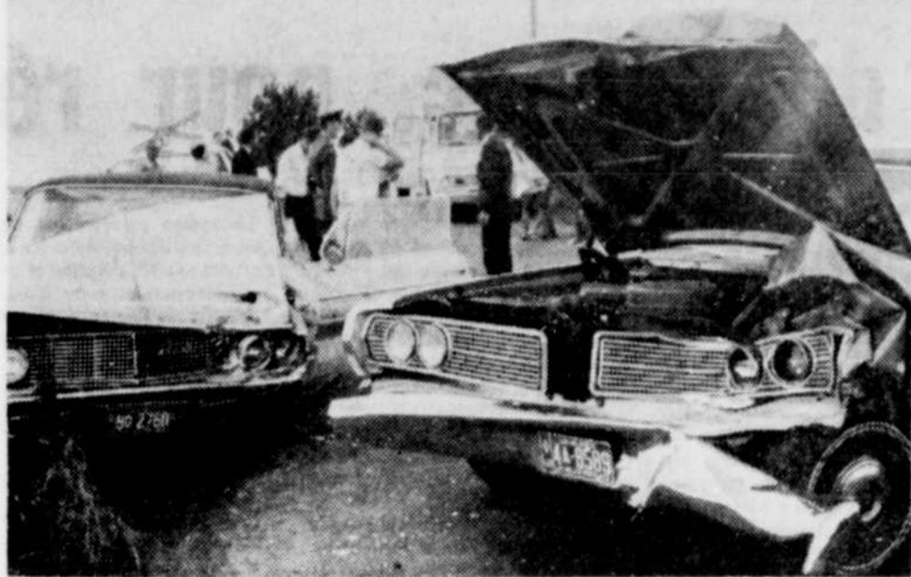
LA POSITION DES DEUX véhicules conduits par MM. Rémi Fontaine et Fernand Couture, de cette ville, à la suite d'une collision survenue dimanche après-midi, vers 2h45, dans le 5e rang de Drummondville au-delà de la traversée à niveau, là même où un citoyen de L'Avenir trouvait la mort en fin de juillet.