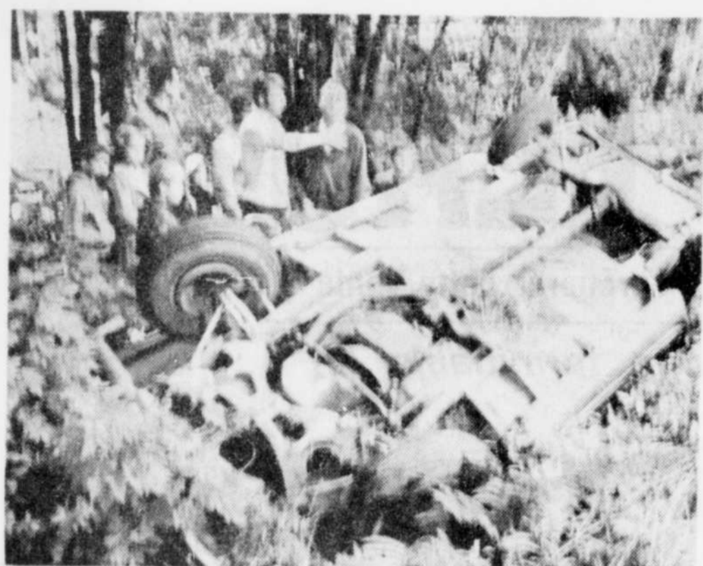
SIX PERSONNES PRENAIENT place dans ce véhicule qui a capoté, dimanche après-midi, sur le chemin Hemming, près de Drummondville. Fort heureusement, personne n'a été blessé dans cet accident qui aurait pu être beaucoup plus sérieux.