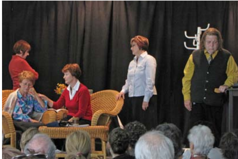
Les comédiens de la pièce de théâtre « Portrait de famille » en pleine action.

La journée régionale s'est terminée par une présentation théâtrale intitulée « Portrait de famille ». Cette pièce, présentée par la table de concertation sur les abus aux aînés de la Mauricie, illustre bien de quelle façon certains événements de la vie comme le décès d'un conjoint ou les difficultés financières d'un enfant peuvent contribuer à créer une situation de maltraitance.