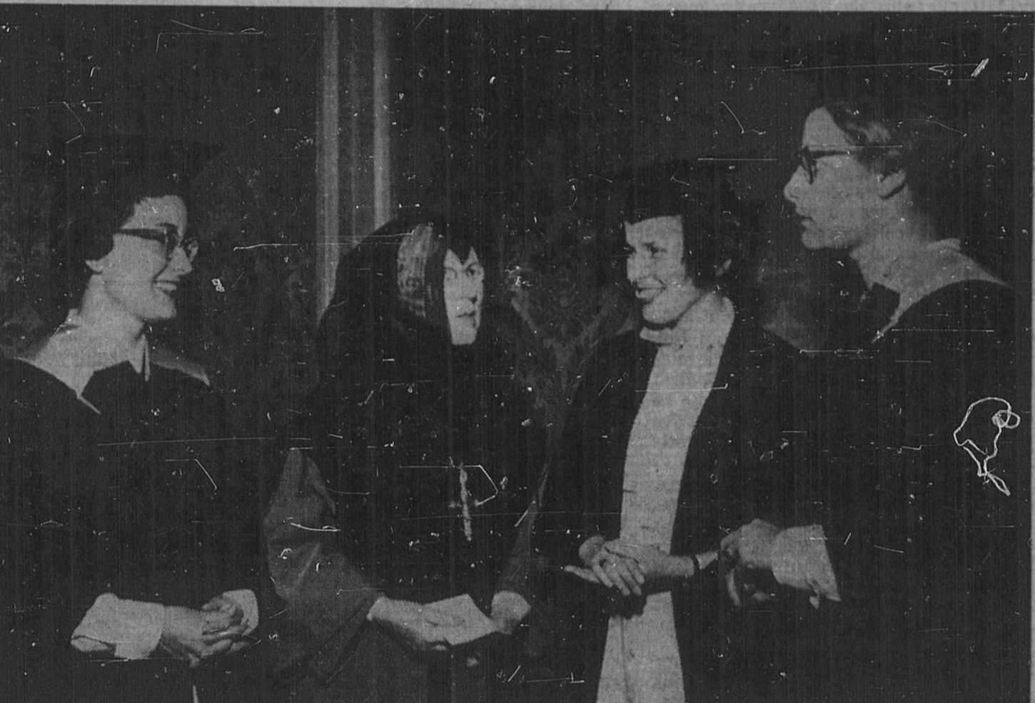
QUATRE DE LA REGION — Lors de la collation des diplômés à l'Université d'Ottawa, dimanche, quatre étudiantes de Sudbury et du Sault-Sainte-Marie ont obtenu leur certificat en éducation des infirmières...