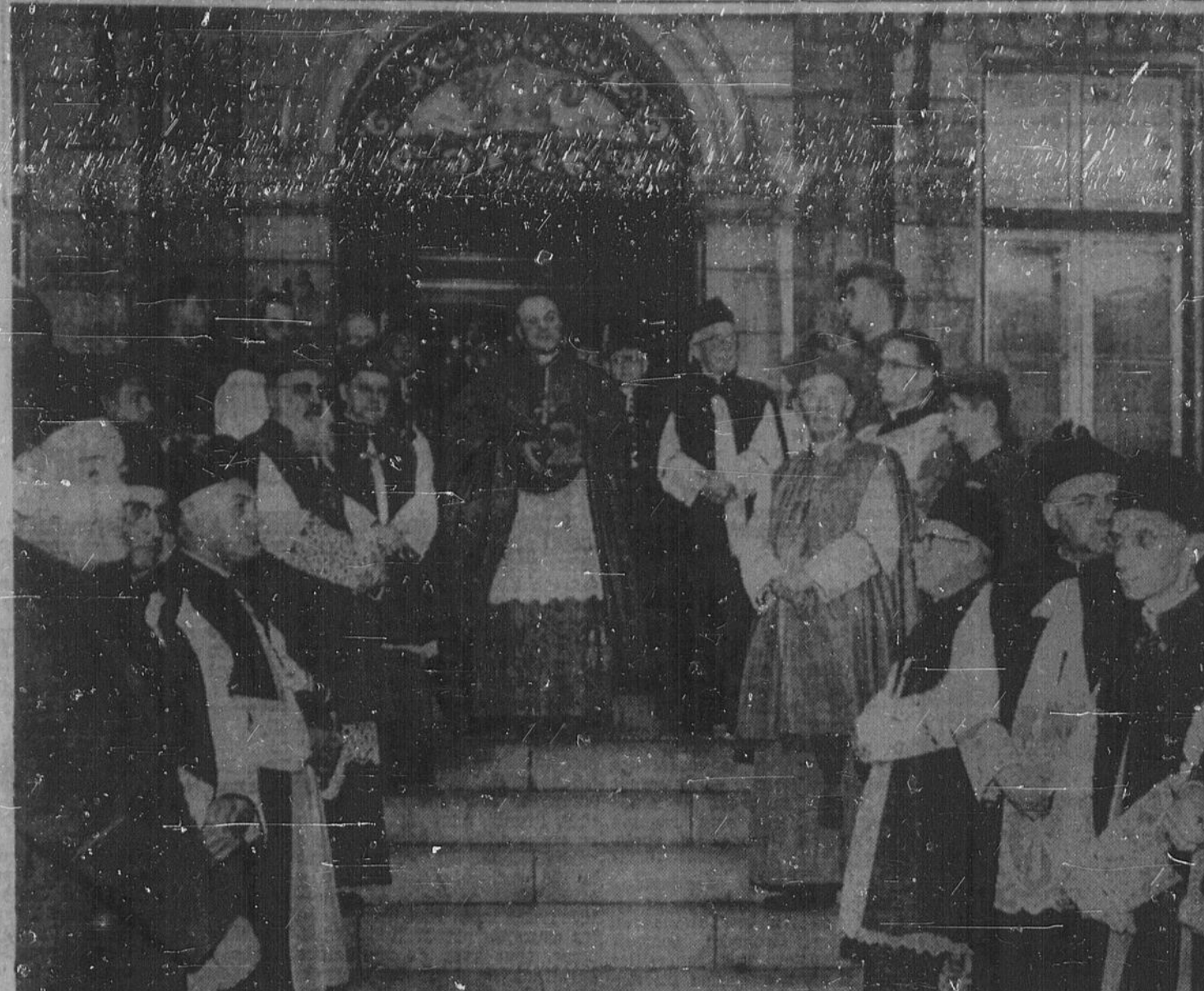
RECEPTION OFFICIELLE — S. Exc. Mgr Sebastiano Baggio, nouveau délégué apostolique au Canada, a été l'objet d'une réception officielle dimanche soir, en la basilique-cathédrale d'Ottawa. De nombreux représentants du clergé diocésain, des communautés religieuses, de la Conférence catholique canadienne...