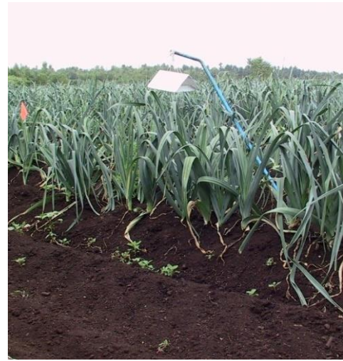
Photos 3 et 4 : Pièges installés convenablement en bordure du champ