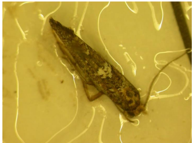
Photos 5 et 6 : Papillon de la teigne du poireau au repos (taille réelle : 6 mm) et capture sur une plaquette engluée

Il est important de passer au moins une fois par semaine et de procéder rapidement à l'identification des papillons sur les pièges. Avec le temps, probablement à cause de la colle, le papillon prend une coloration noirâtre uniforme et le petit triangle blanc tend à disparaître. Si on attend trop, il ne sera plus possible de distinguer les teignes des autres petits papillons gris de même taille.