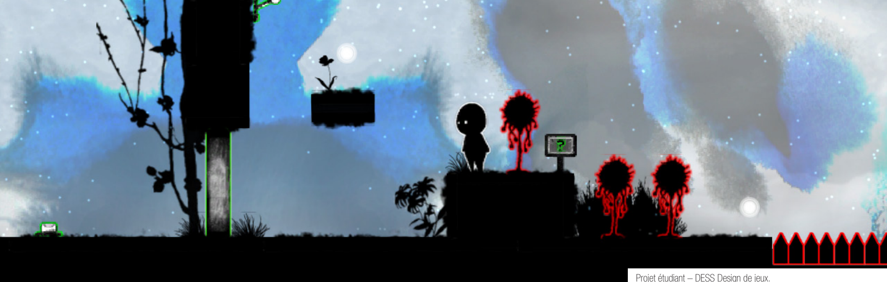
Projet étudiant – DESS Design de jeux.