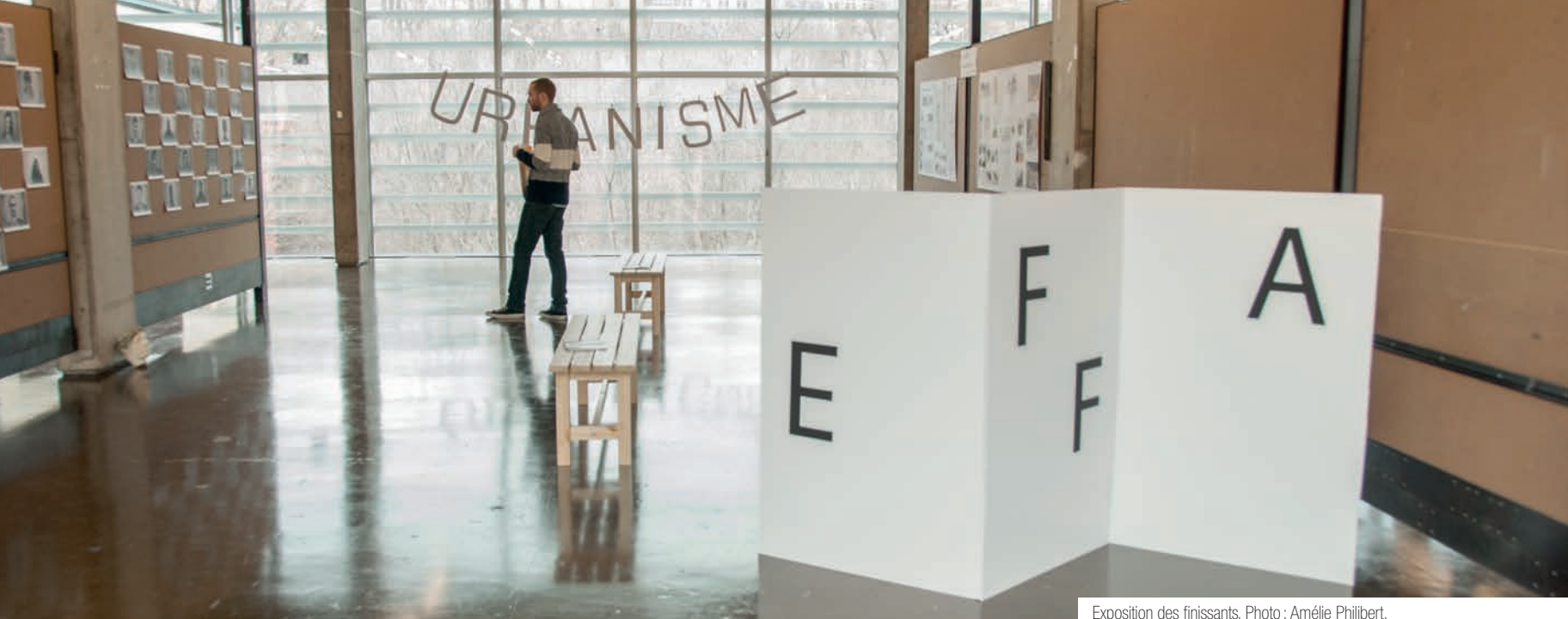
Exposition des finissants.