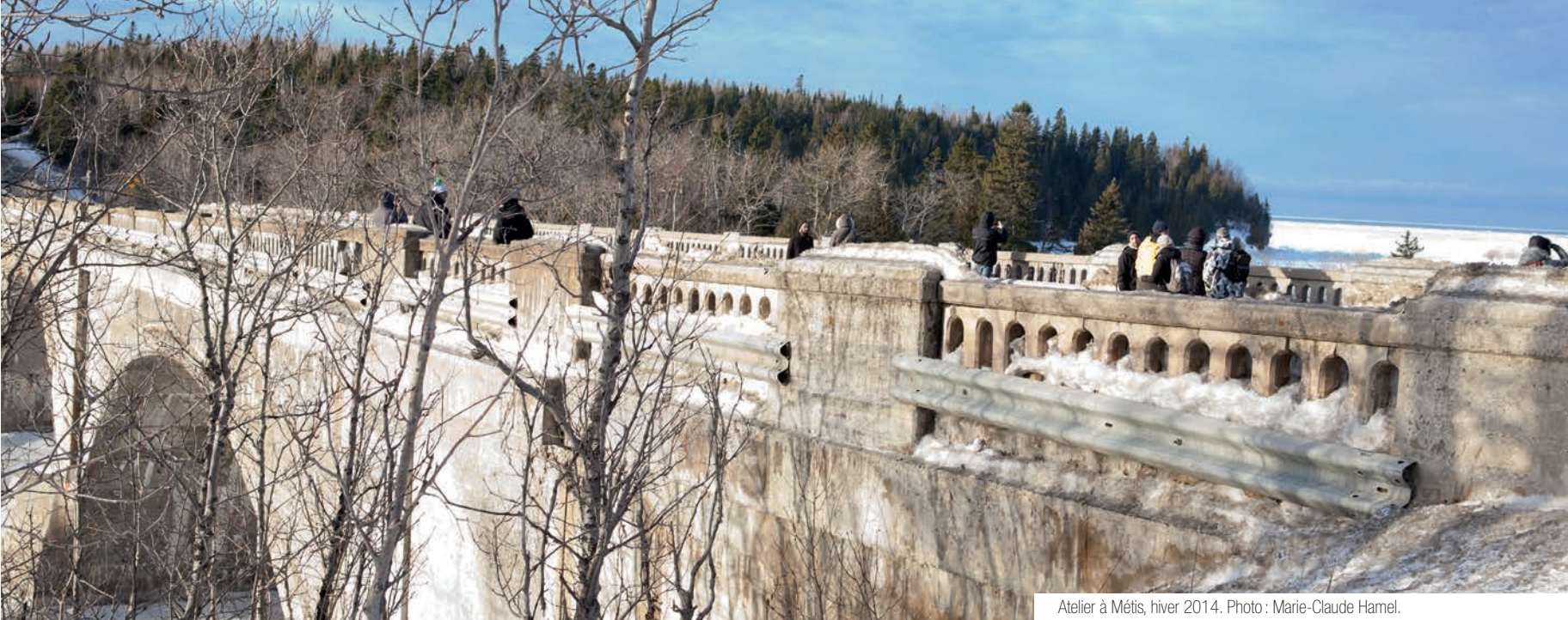
Atelier à Métis, hiver 2014.