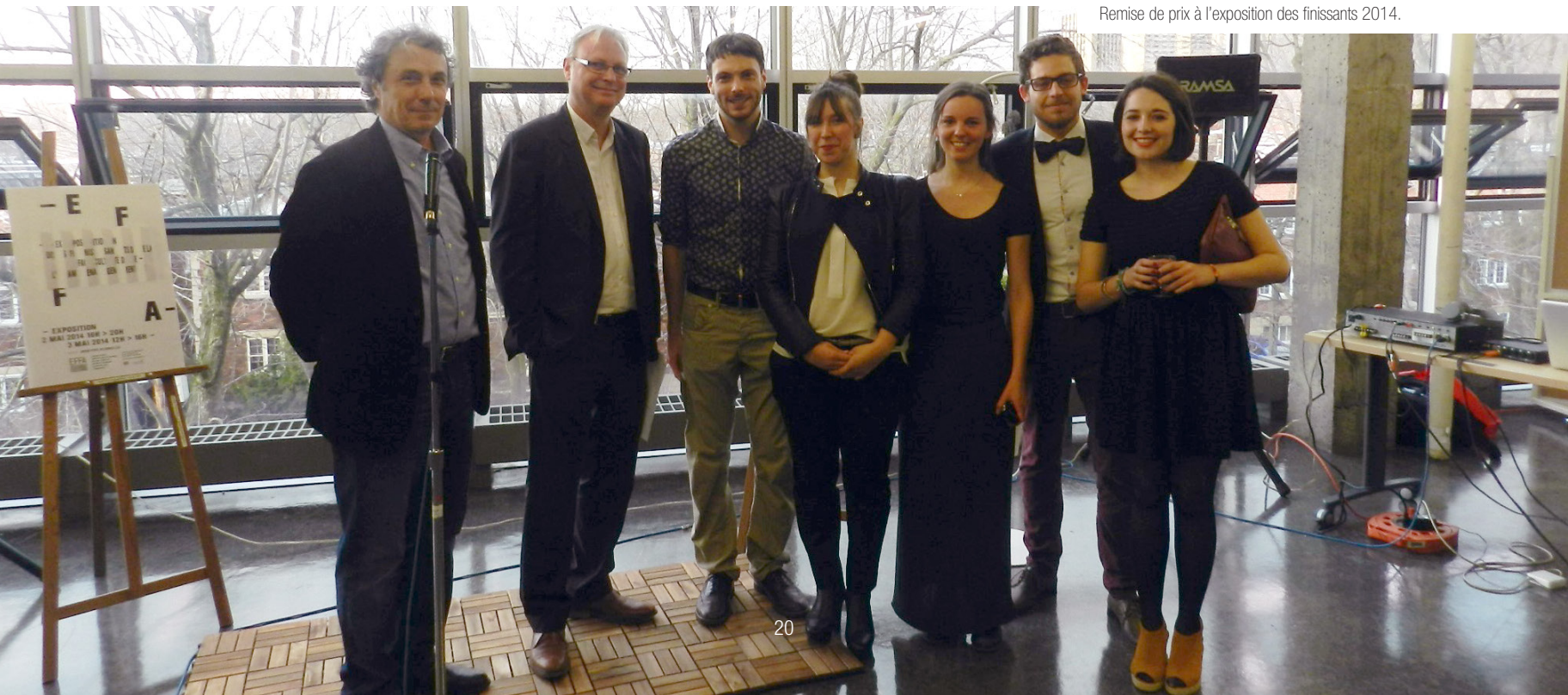
Remise de prix à l'exposition des finissants 2014.

L'année 2013-2014 s'est achevée par la tenue, en collaboration avec le Département d'études urbaines et touristiques de l'Université du Québec à Montréal, des Journées APERAU 2014, fin mai. Les Journées APERAU est un événement qui est organisé chaque année dans une ville différente pour rassembler les membres de l'Association, et plus généralement la communauté universitaire francophone de l'urbanisme et de l'aménagement. Elles comprennent une journée dédiée à la tenue de l'Assemblée générale, un colloque scientifique international sur une problématique ou un thème majeur de l'urbanisme ou de l'aménagement, ainsi qu'une journée des doctorants ou, comme cette année à Montréal, une journée jeunes chercheurs pour favoriser la vitalité de la relève universitaire en aménagement et urbanisme dans la francophonie.