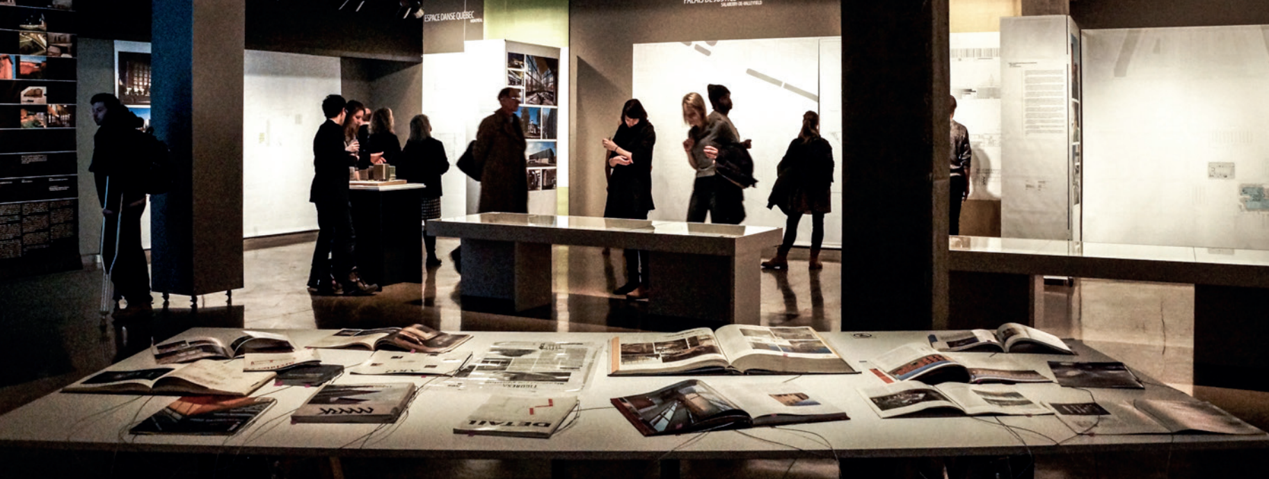
Vernissage de l'exposition Lapointe Magne et Associés (1992-2012) : Dialogues avec la ville en transformation, présentée du 27 février au 23 mars 2014.