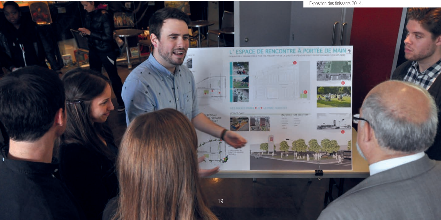
Exposition des finissants 2014.

La maturation de l'équipe professorale se lit notamment par les succès obtenus dans les demandes de subvention de recherche et les publications. Parmi les premières, on peut citer le projet « Le vieillissement en ville moyenne ou en région