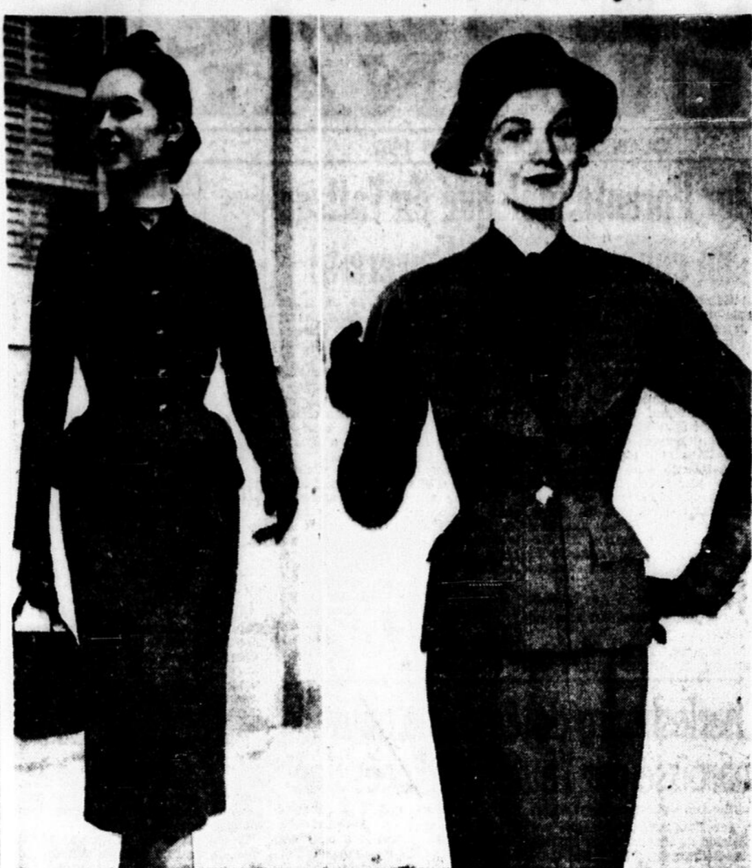
Le costume de flanelle grise est un des thèmes favoris de la mode automnale dont voici deux attrayantes variations. Le modèle de gauche est d'un style jeune et la jaquette, bien rentrée, est fermée par une rangée de gros boutons de cuire bien astiqués. Le tailleur de droite est plus classique sans cependant tomber dans la rigidité. Le mouvement des épaules est doux de même que la ligne des revers d'un grand chic. L'élegante porte ce costume sur une blouse rouge clair.

en voyage, SOULAGÉE à l'aide de NAUSEE. Système nouveau. Par tout le monde.