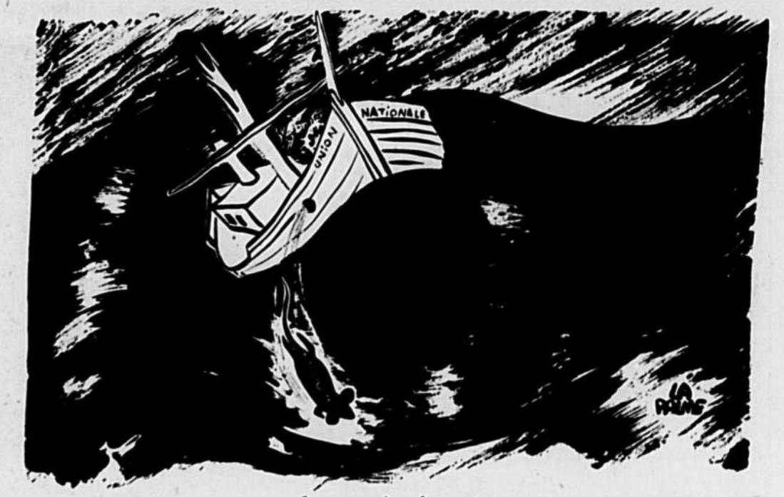
Le premier à sauter

«L'expérience acquise n'était pas variée, autant dire qu'il n'y avait pas. Franchir les rapides devient routine quotidienne. Voici brièvement ce que fit le premier convoi: prit le fond, mouilla des bouées pour indiquer les chenaux et les rocs submergés, étudia les passages les plus dangereux, etc.»