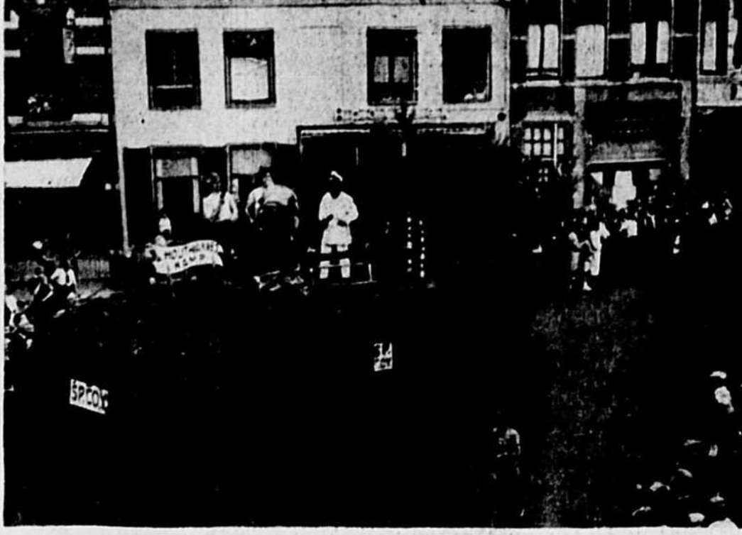
Les gars du Régiment de la Chaudière ont célébré la St-Jean-Baptiste, à Amersfoort, en Hollande, le 23 juin dernier, par une grande parade. Chaque compagnie du régiment avait son propre char allégorique. On voit ici la foule, massée sur les trottoirs, regardant passer le défilé.