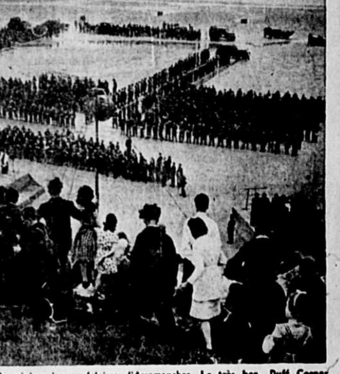
Les autorités françaises ont organisé des cérémonies le 6 juin 1945, sur les plages normandes où les alliés avaient effectué leurs premiers débarquements un an plus tôt.