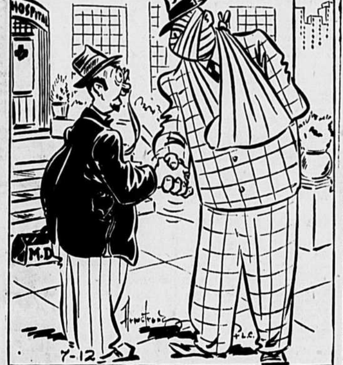
"Je ne me souviens pas du nom, mais votre visage m'est familier."