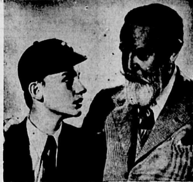
Roddy McDowall et Monty Woolley, qui sont avec Gracie Fields, les principaux interprètes du film "Molly And Me" à l'affiche du cinéma Capitol à compter d'aujourd'hui.