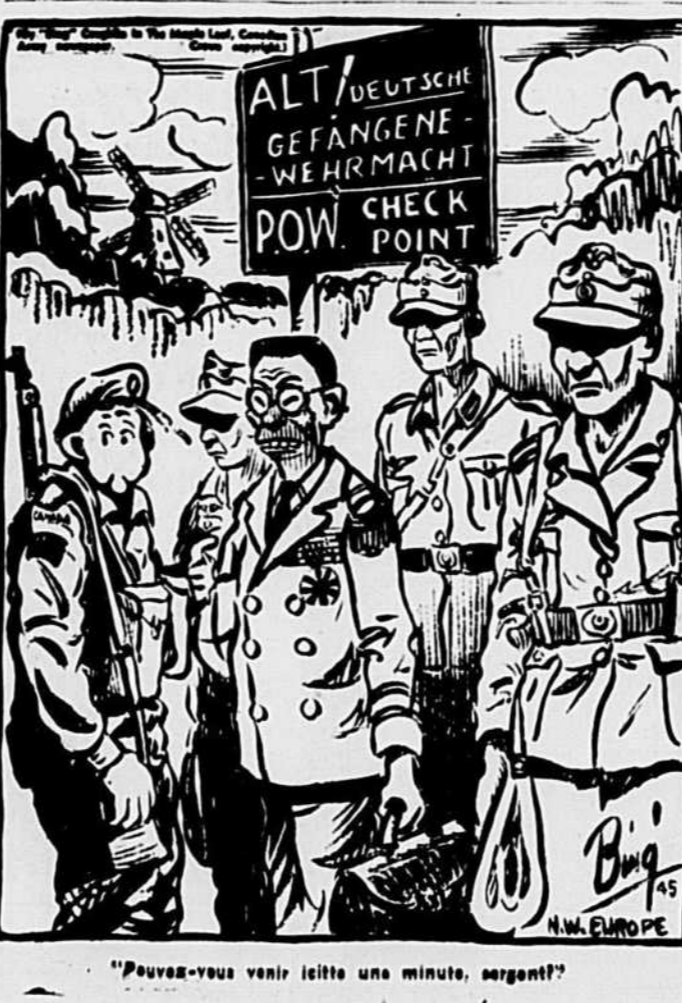
"Pouvez-vous venir ici une minute, sergent?"

Soleil et Plaisir Le Maple Leaf Inn, sa magnifique piscine, ses larges pelouses, son confort, son centre d'attraction dans les Laurentides. Tennis, golf, équitation, excursions, cuisine française incomparable. Au bord de toutes les lignes de transport. Au bord de toutes les lignes de transport. Au bord de toutes les lignes de transport. MABLE LEAF Inn seulement de Montréal en auto, à deux minutes des gares du C.P.R. et du C.N.R. SHAWBRIDGE, P.Q., TEL. 39