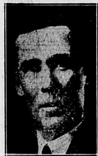
M. Joseph B. Chifley, 59 ans, ancien mécanicien de locomotives, sera assermenté aujourd'hui comme premier ministre d'Australie, succédant à feu John Curtin.