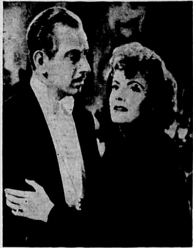
Melvyn Douglas et Greta Garbo, en vedette dans le nouveau film traduit en français "Mon mari, ma jumelle et moi" qui passe actuellement au cinéma Orphéum.