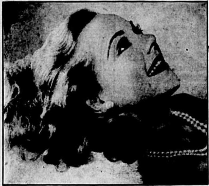
Le cinéma Palace présentera, à compter de vendredi, le nouveau film de la vedette des sports d'hiver Sonja Henie. Ce film s'intitule à bon droit "It's A Pleasure".