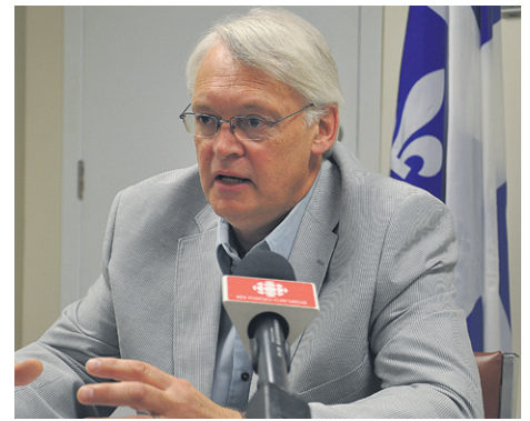
Le député Gaétan Lelièvre.

L'an dernier, l'achalandage avait diminué de 9% à Fort-Prével et le déficit accumulé au fil des ans se chiffre à près de 15 millions de dollars.