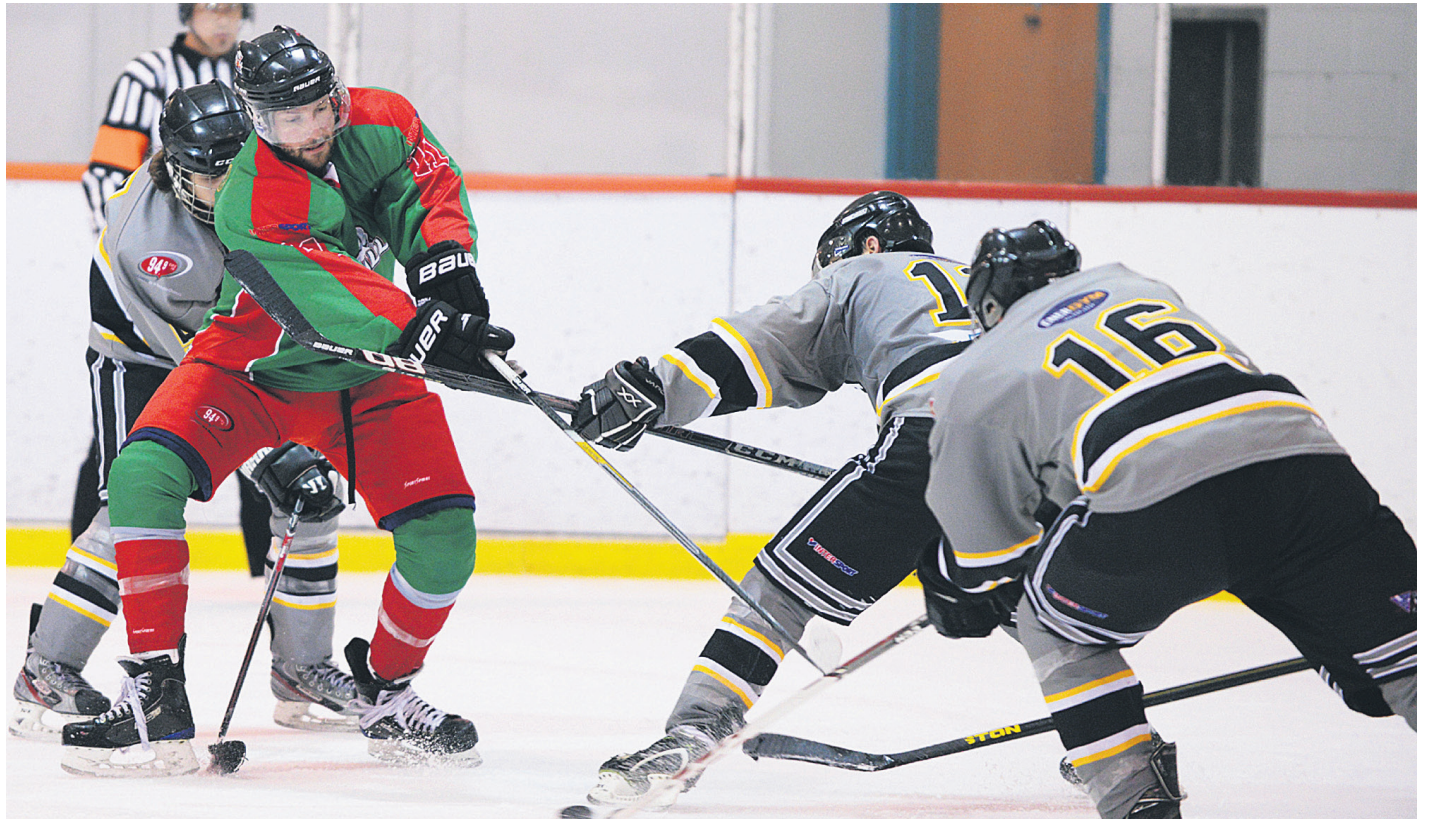
Les spectateurs et les joueurs pourront s'attendre à du hockey de haut calibre lors de la reprise des activités, le 30 octobre.

Les distances accrues ont forcé l'organisation à adapter son calendrier pour éviter d'imposer trop de longs voyages aux joueurs. Ainsi, les équipes de l'ouest (Carleton et New Richmond) et de l'est (Grande-Rivière, Gascons) du territoire s'affronteront trois fois chacune, tandis qu'elles joueront