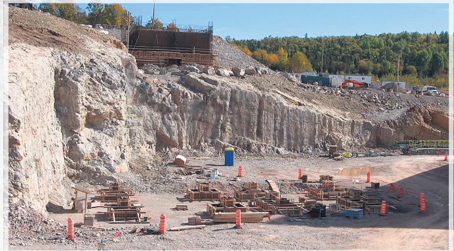
Plus de 800 personnes travaillent sur cet immense chantier.

Cet approvisionnement devra s'effectuer localement, parce que la biomasse sera requise en grande quantité. Ciment McInnis travaillera