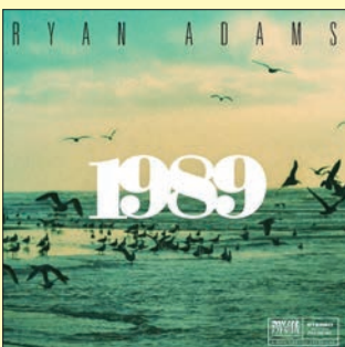
Couverture de l'album

Vous avez une suggestion d'album pour le prochain numéro? N'hésitez pas à m'écrire!