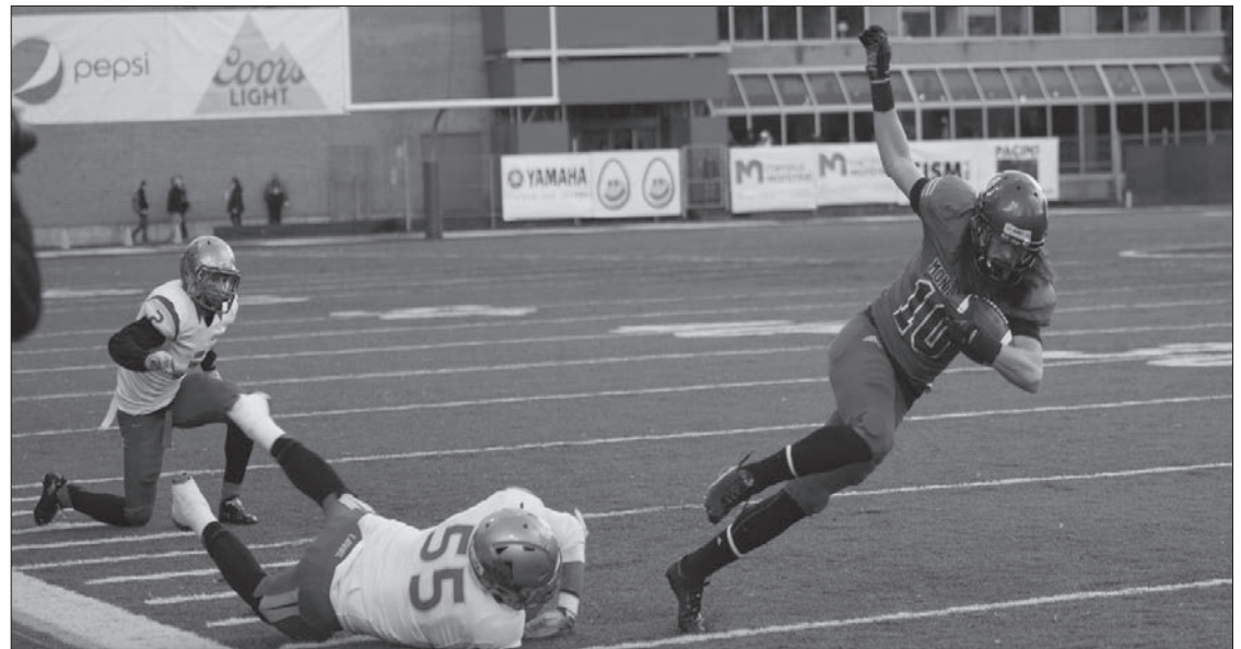
Un genou à terre pour saluer les Bleus qui s'envolent vers la victoire

Au final, avec une victoire contre Laval, une victoire de Sherbrooke 7 à 0 contre McGill et une défaite de Bishop 0 à 63 contre Concordia, les Bleus restent seconds du classement RSEQ. Bien qu'une défaite contre Bishop soit peu envisageable, une défaite contre Concordia le 31 octobre 2015 pourrait mener les Bleus à la troisième place et ainsi les priver de demi-finale malgré leur quatrième place au classement universitaire canadien pour le moment. Soyez donc là en masse pour le dernier match de la saison régulière!