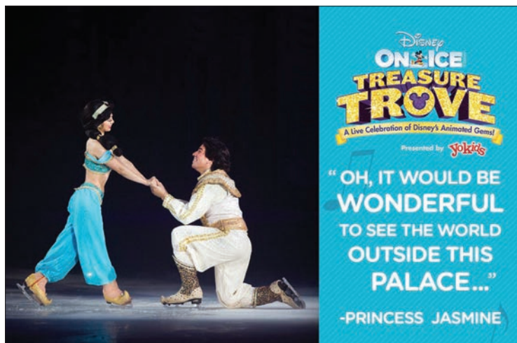
Un nouveau mooooooooooode!

tions aux spectateurs grâce à des scènes cultes allant du décès du père de Simba jusqu'à la chanson d'amour entre Simba et Nala, en passant bien sûr par la célèbre chanson « Hakuna Matata ». Les chorégraphies de cette pièce étaient impressionnantes, surtout après le piètre début du spectacle.