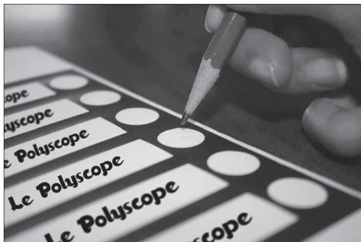
Voilà un bulletin de vote qui ne nous donnerait pas trop de maux de tête. Je pourrais être grand timonier, ou secrétaire général.

Ainsi, quelques jours après la défaite de Sauron, oups, de Stephen Harper, il ne faut pas oublier que le combat pour les choses qui nous tiennent à cœur, que ce soit la justice sociale, l'environnement ou les droites des femmes, n'est pas terminé. Allez, bonne mi-session à vous et joyeux halloween!