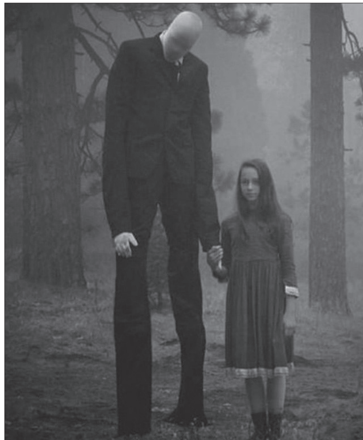
Petite promenade dans les bois avec Slender Man.

n'a pas vraiment de quoi ébranler une personne un tant soit peu rationnelle. Finalement, une creepypasta fait peur comme un mauvais film d'horreur; la plupart du temps, au-delà de la curiosité, elle attire au mieux l'indifférence, au pire l'amusement. Vous pouvez vous recoucher tranquilles.