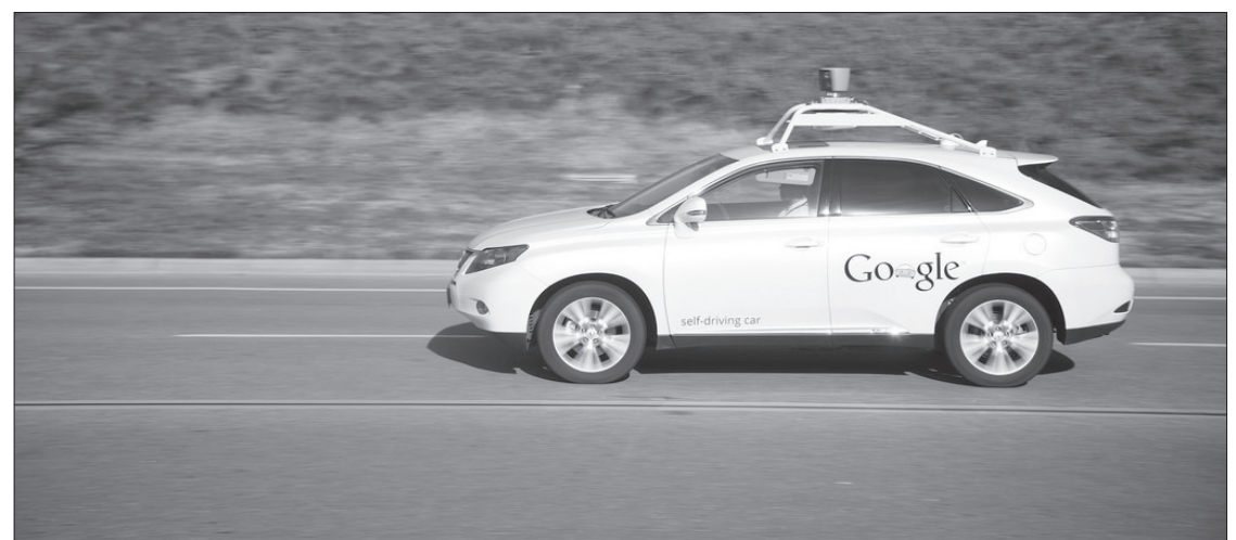
Google self-driving cars.

Google, the leader in the field, has been working on its own project since 2009 and announced in June 2015 that their vehicles had driven a total of 1 million miles in California and Texas. That is impressive considering that according to the company, the cars only had 14 minor accidents, all