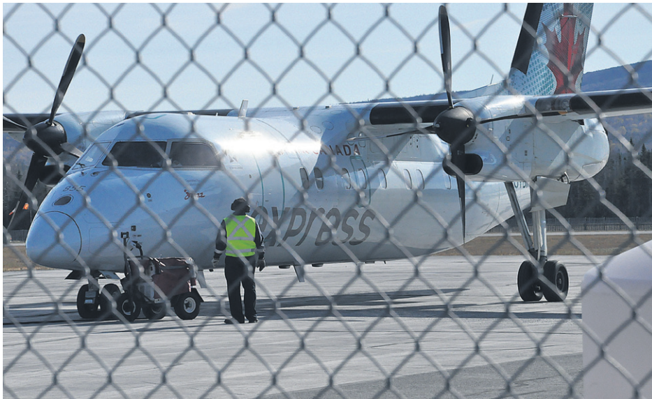
Plusieurs usagers rêvent du jour où ils pourraient embarquer sur un vol à bas prix vers la Gaspésie.

JEAN-PHILIPPE THIBAUT jean-philippe.thibault@tc.tc