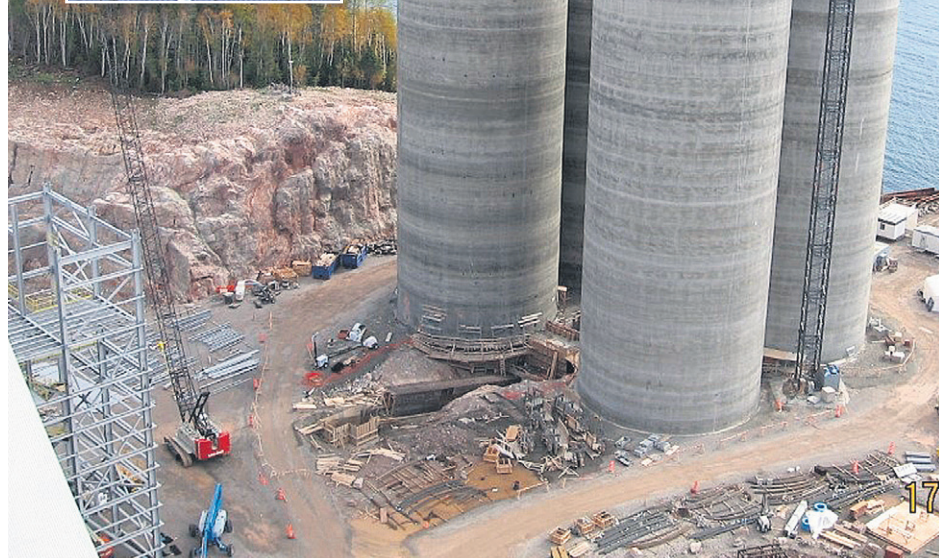
Ciment McInnis a entamé un processus de recherche internationale pour son nouveau président-directeur général.