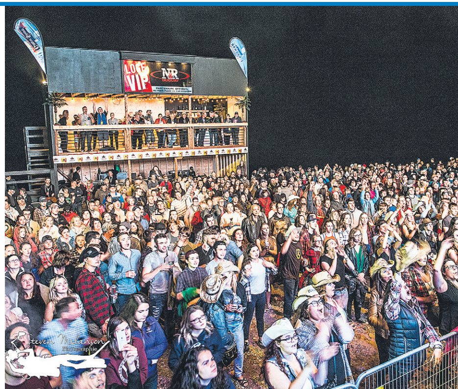
La foule vient de partout sur la péninsule pour assister aux spectacles du Festi-Plage.

Plusieurs DJ professionnels ont aussi fait vibrer la foule, soir après soir. « C'est un concept fort apprécié par les fans du Festi-Plage et il