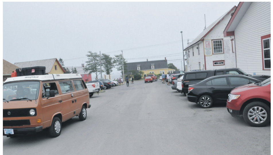
Le projet de rue commerciale fera l'objet d'une signature de registre le 16 août prochain.